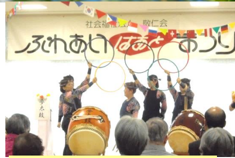
夢太鼓様による演芸 オリンピック開催を祝って