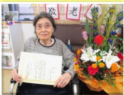
ご長寿・米寿の方が表彰されました。 職員がお祝いのソーラン節を披露し とても盛り上がり、楽しめました。