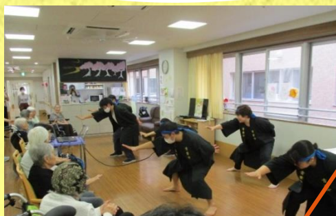
どっこいしょ～！ どっこいしょ～！ 超ノリノリ！ソーラン節！ 皆様も笑顔で拍手喝采！