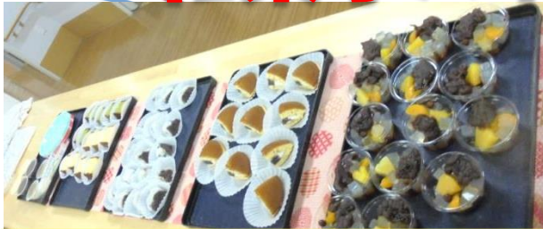
色とりどりの和菓子に悩めます