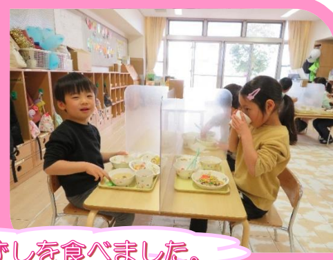
給食は ちらしずしを食べました。