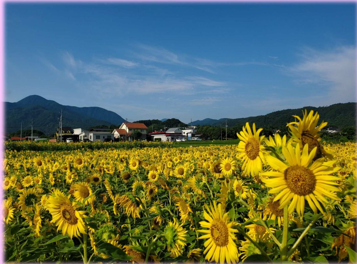
鹿野のひまわり畑