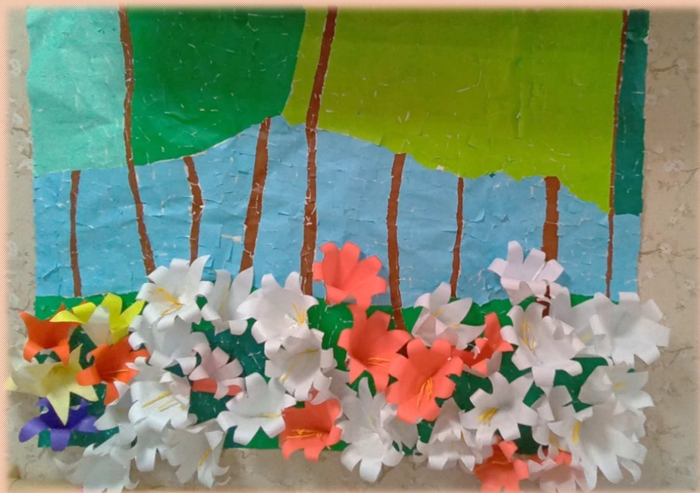
デイサービスご利用者様作品: 百合の壁画

百合の時期ですね。レクリエーションの時間に百合の壁画作りをしました。ご利用者様で作業を分担し、百合の花を作る方、がくを作る方、出来た百合の花を貼り付ける方に分かれて取り組まれました。とても素晴らしい作品が出来上がり、フロアがとても明るくなりました。