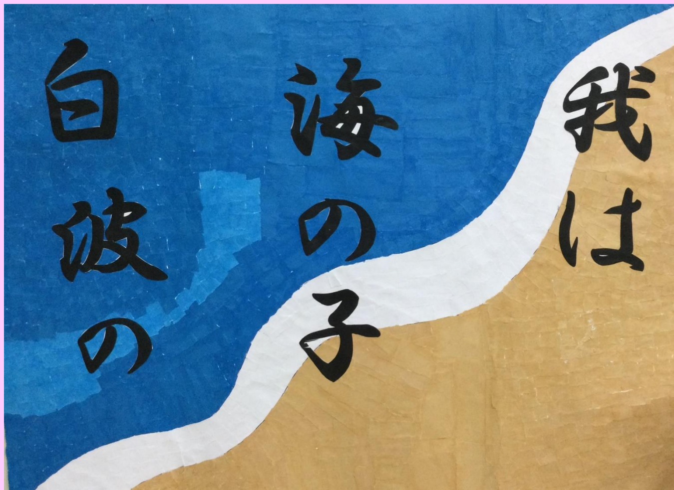
1階ご利用者様作品:夏のちぎり絵

「夏らしい作品が作りたいね」との声があり、ご利用者様同士が相談され「海のちぎり絵」を作る事が決まりました。黒い文字は細かくて難しかったですが、手先の器用なご利用者様が「私がやってみようか？」とフォローして下さり、皆様で協力して完成する事ができました。まだまだ暑い日が続きますので、このちぎり絵を見てもう少し夏を楽しみたいと思います。1階の食堂の出入りに掲示してありますので是非ご覧ください。