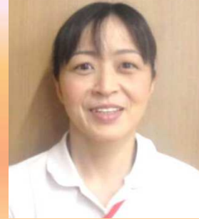
椎 難 ケアワーカー

はなみユニットで、勤務しています。 ご利用者様が、その人らしく、笑顔で楽しい毎日を送って頂けるよう、そして、グループホームゆいはまを選んで良かったと言ってもらえるよう、頑張っていきますので、よろしくお願い致します。