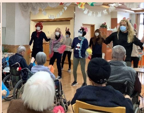
お祭りマンボーに合わせて踊ります！（ユニット）