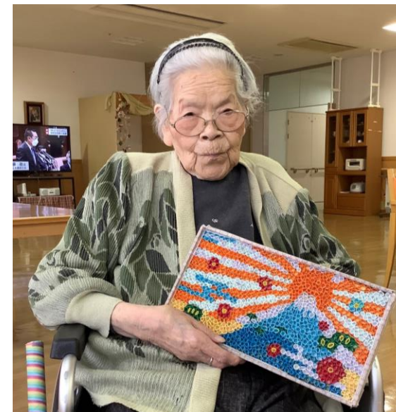
リハ作品 富士の日出