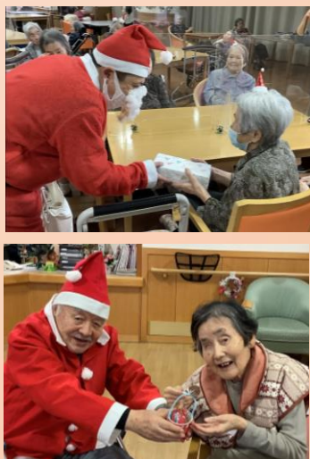
ささやかなプレゼントをお渡ししました