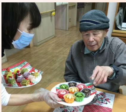
皆さんお楽しみのケーキバイキング