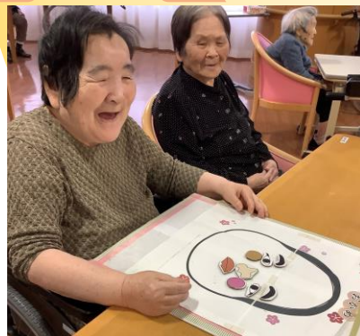
昔懐かしい福笑い