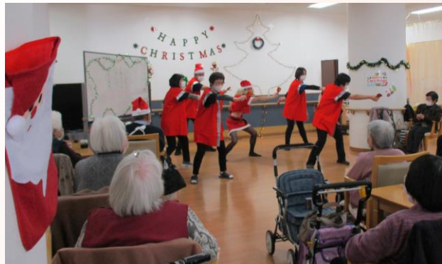
通所名物 ソーラン節

特に踊りが大好評で、日頃あまり見ない職員の姿に「すごい！良かった。」「楽しかったわ」等、大変喜ばれ楽しい時間を提供できたかな？と思います。終了後はケーキとコーヒーを提供、これもまた大変好評でした。