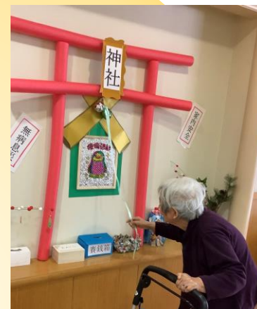
今年の健康を祈って、