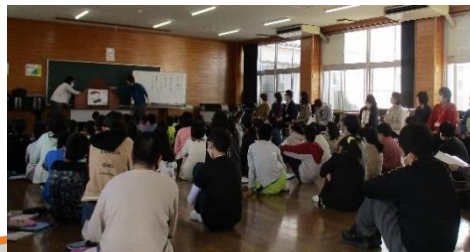
紙芝居を聞く児童のみなさん

北条町主催の認知症サポーター養成講座に、助言者としてル・サンテリオン北条から2名の職員が参加しました。北条小学校の5年生のみなさんと紙芝居を通じて、認知症とはどのようなものなのか、具体的にどのように関わればよいのかを一緒に考え、話し合いました。