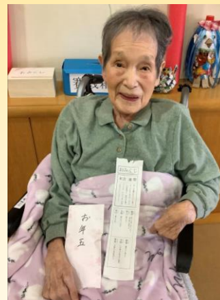
お参りの方にはおみくじがありました