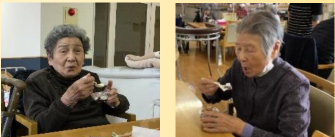
皆さんおいしそうに食べてくださいました！