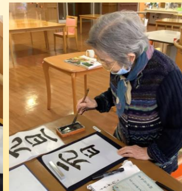
筆を持つ姿は真剣そのもの

お正月は、施設内でも初詣ができるよう3階フロアに鳥居を設置しました。入所中のご利用者が、今年の願いを込めてお参りされました。その他、各フロアで書初めや福笑いなどのお正月を感じられる活動をしました。