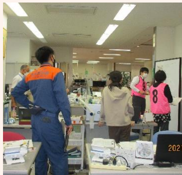
訓練中の動きを消防の方に 見ていただきました