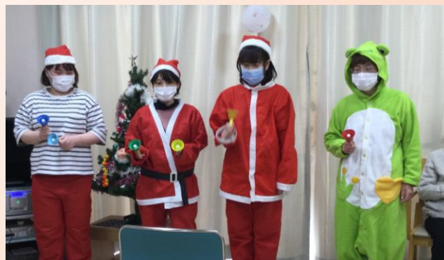
ハンドベル演奏（グループホーム）