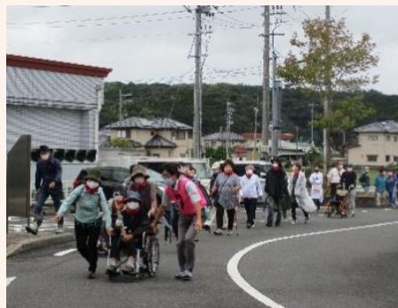
土下地区からの避難の様子