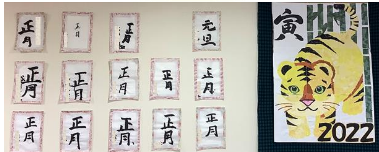
ご利用者の書初めと寅の壁画（老健 準ユニット）