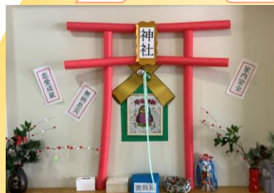
施設内に手作り神社が登場