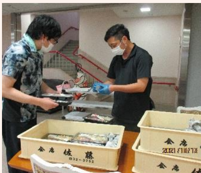
非常食を各フロアに振り分け中

午後には、地震と火災の避難訓練をしました。地元土下地区からも一時避難所という想定で住民の方が避難にいられました。避難所としての機能と感染対策を両立させるため、入所フロアと接触しない工夫、受け入れ前の検温や行動歴の確認など、事前準備もしていましたが、実践で見える反省点もありました。土下地区にお住いの皆様、鳥取防災様、鳥取県中部消防局様ご協力のもと、より実践に近い訓練を実施することができました。