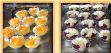
オレンジとブドウの2種類を用意

11月25日 毎月恒例のケーキバイキングを開催しました。「今回は厨房職員手作りのパンナコッタです！」と紹介すると、耳慣れない単語に「なんだって？」と会場がざわつきましたが、実物を見て「きれい、かわいい」と盛り上がり、一口食べて「おいし〜い」と笑顔があふれ、大変喜んでいただきました。（通所）