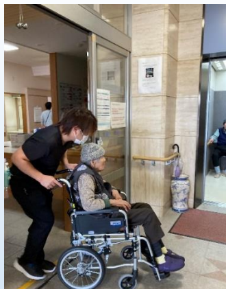
ご利用者をエレベーターへ誘導

エレベーターが使えない場合は階段を使って非難する必要があります。そのようなケースを想定し、職員をモデルに歩行が難しい方の階段での避難も実施しました。