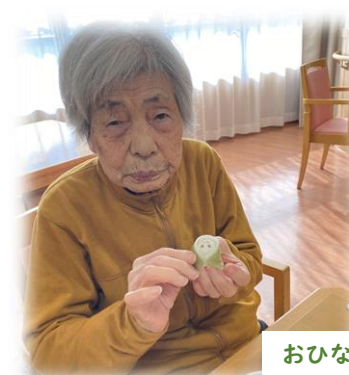
おひなさまの和菓子を提供しました