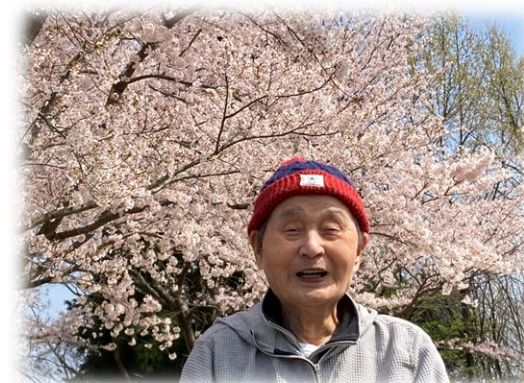
桜を背景に素敵な写真が撮れました