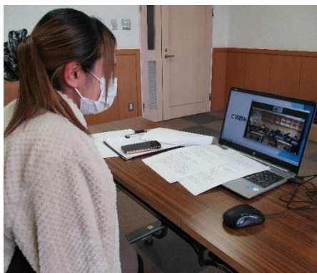
画面越しに中学生と交流

「社会人に学ぶ」学習に取り組んでいる北条中学校1年生に向けて、高齢者施設で働く栄養士の仕事内容をZOOMで講義しました。