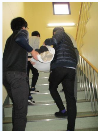
階段を使った避難訓練

介護老人保健施設 ル・サンテリオン北条 TEL 0858-36-5220 FAX 0858-36-5224 E-mail houjou@med-wel.jp ホームページ https://www.med-el.jp/houjou/