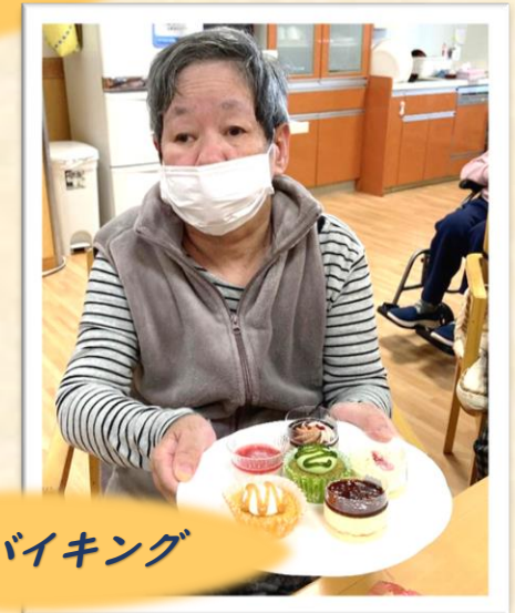
ケーキバイキング