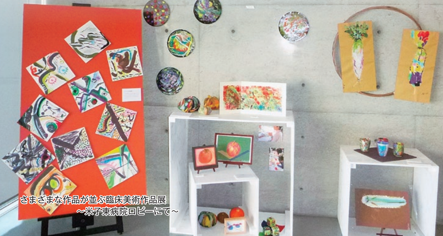
さまざまな作品が並ぶ臨床美術作品展 ～米子東病院ロビーにて～