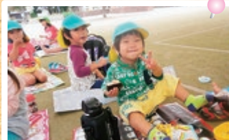
秋の遠足で奥大山サントリー工場と皆生海浜公園へ行きました。(ババール園)

入院患者さまによる「オートハーフ演奏会」が開催されました。綺麗な音色に合わせて、荒城の月などを皆で歌い素敵な時間を過ごしました。