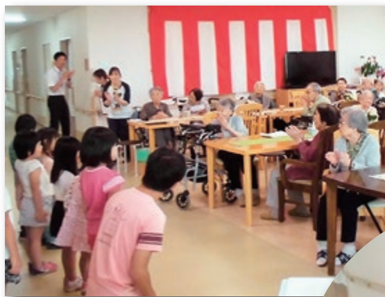
よどえババール園の園児も駆けつけました。

米寿などのご長寿のお祝いに加え、よどえババール園の園児による歌とダンスの披露など、笑顔あふれる楽しい敬老会となりました。