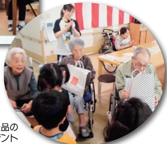
園児から記念品のプレゼント