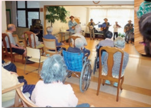
ボランティアの方の演奏を楽しみました。

バイキングに舌鼓を打ち、演芸に酔いしれ、よどえババール園の子ども達の握手に元気をもらい楽しい敬老週間を過ごしました。107歳の方を筆頭に今後も笑顔あふれる老健で頑張ります。