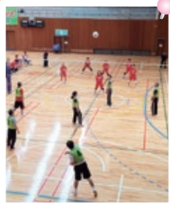
精神障がい者バレーボール大会に参加しました。次は来年の中四国大会に出場予定です。