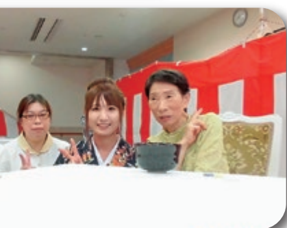
お茶も振る舞われました。