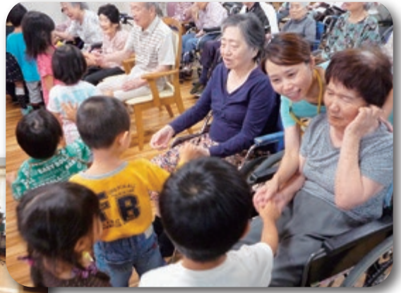
よどえババール園の園児も一緒にお祝いしました。