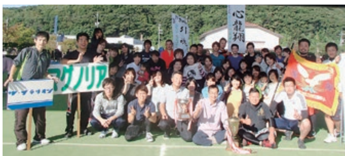
総合優勝の藤井政雄記念病院・マグノリアル・ソラリオンの合同チーム