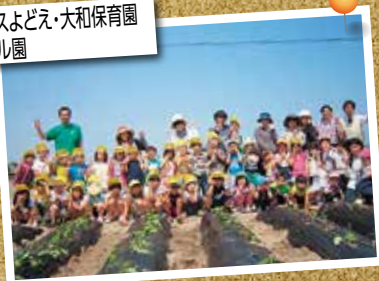
ル・サンテリオン鹿野