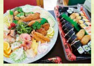
ピクニックにでかけたくなるメニュー

「おっ、今日はごちそうですね！ 「はい、定期的にイベント食を提供して、今日はオードブル風にしてみましたよ」