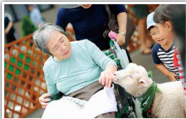
動物との触れ合い