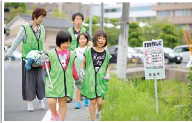
ゴミ拾い隊が出勤し、地域をきれいにしました