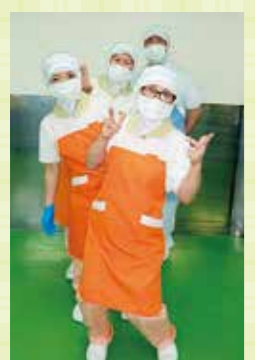
私たちが作ってます

「工夫されている点があれば教えてください。 「盛付です。見た目でも楽しんで頂けるように、アイデアを出し合っています」 「次は何が食べられるのか、楽しみにありますね。 「食」は生きる喜びの一つです。それを担う部門として、今後も腕によりをかけて業務を行っていきたいと思います。」