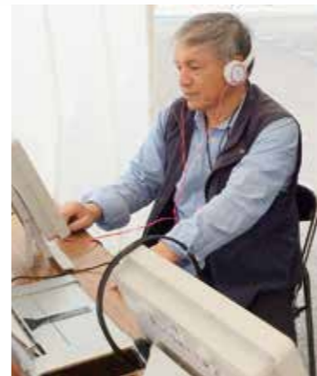
相談コーナーでタッチパネル式検査に挑戦する参加者

今年度の認知症コーナーは、鳥取県中部で唯一の認知症カフェ「オレンジカフェとま」と認知症疾患医療センターのタイアップで行いました。