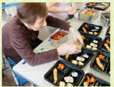
ご利用者も一緒にお弁当作り

「工夫されている点があれば教えてください。 「盛付です。見た目でも楽しんで頂けるように、アイデアを出し合っています」 「次は何が食べられるのか、楽しみにありますね。 「食」は生きる喜びの一つです。それを担う部門として、今後も腕によりをかけて業務を行っていきたいと思います。」