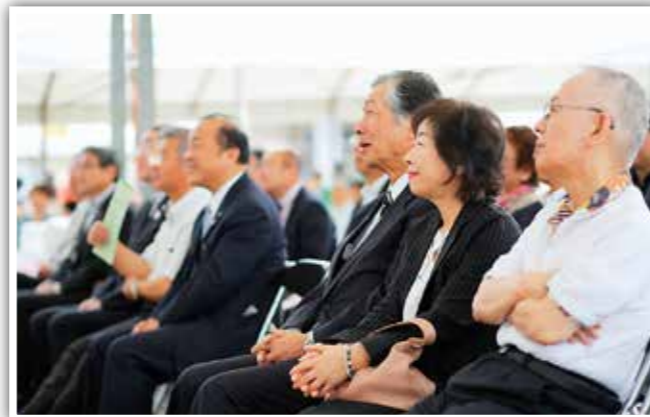
メインステージはいつも大盛況でした