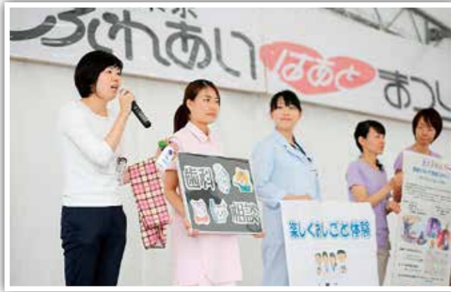
職員による各コーナーのPR