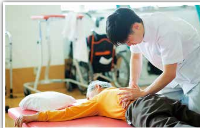
普段抱えている体の悩みをリハビリスタッフが解決!

6月4日(土)、社会医療法人仁厚会・社会福祉法人敬仁会の第61回創業祭ふれあいはあとまつりを「地域へおもてなし～伝える・伝わる“ありがとう”～」をテーマとして開催し、約3千人の方々にご来場いただきました。キャラクターショーなどのステージイベントはもちろん、倉吉病院や藤井政雄記念病院内を利用した屋内イベントも年々充実。鳥取県立厚生病院の検査技師をお招きしての血圧年齢測定や、倉吉病院の認知症疾患医療センターとオレンジカフェの提携イベント等、地域の力をお借りした企画はどれも好評でした。 この他にも、倉吉病院認定看護師による心の健康相談コーナー、藤井政雄記念病院検査室による体のバランス測定、米子東病院理学療法士による体組成計を使用した身体のチェック等々、病院の設備や人材を活用した健康増進につながるイベントも盛況でした。 益々皆様へ愛される法人となるよう日々精進してまいります。来年のまつりにもぜひご来場ください。