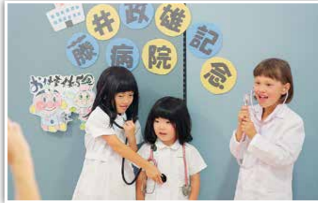
お仕事体験でかわいい看護師さんに変身!