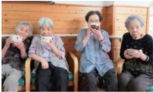
「久しぶりの抹茶は美味しいですなあ〜」