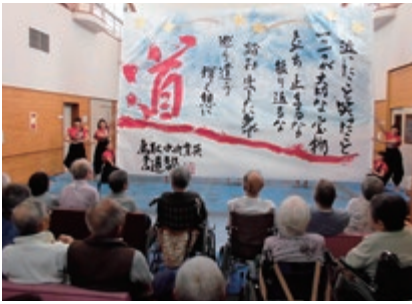
迫力の書道パフォーマンス!!

9月12日(月)から敬老週間が始まり、お茶会やカフェ、敬老パチンコにババール園園児との交流、鳥取中央育英高等学校書道部による書道パフォーマンスなど様々な催しが行われ、楽しそうに過ごされていました。17・18日にはデイケア・老健・グループホームでそれぞれ式典・家族交流会を行い、ご長寿の方へのお祝い品の贈呈等を行い、皆でお祝いをしました。