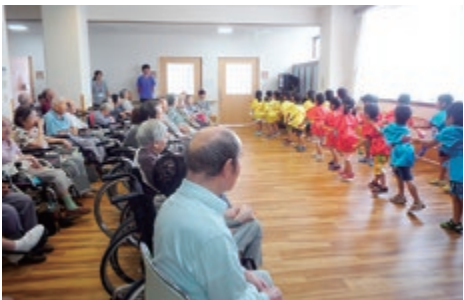
園児の元気な踊りに拍手喝さい

106歳を筆頭に白寿・卒寿などのご長寿の表彰。利用者の方々の作品展示会。ボランティアのどじょう揃いや日本舞踊に笑いや拍手で盛り上がりました。大和保育園の園児との交流会では笑顔と涙があふれ、バイキング料理にはいつもよりお箸がのびてお腹一杯に。楽しい時間を過ごしていただきました。