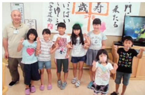
ぶんぶんコマを手にニコリ

入居者と一緒になり、缶バッチやぶんぶんコマを作るなど楽しい時間を過ごしていただきました。これからも、地域の皆様と交流できる行事を企画していきます。