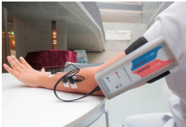
MURRO を使用したリハビリテーション

米子東病院ではこの夏に「MURRO ソリューション (以下、MURRO) というリハビリ機器を導入しました。簡単に説明しますと、①MURROが病気で弱くなった脳からの命令を感じし増大させ、筋肉を動かす。②脳の命令で筋肉を動かすことが感覚神経を介して脳に伝わる。③脳が「自分の命令で