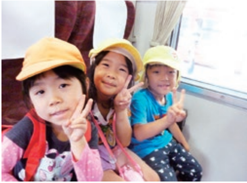
ルールを守って楽しく乗車できました

大和保育園年長児25名とよどえ バブル園年長児5名がJRの特 急列車乗車体験「旅育」に参加し ました。 まず米子駅で切符の買い方や電 車に乗る際の約束事などを教えて いただきました。お話の後は、い よいよ特急列車『やくも』に乗っ て松江駅まで往復の旅です。ワク ワクしながら電車に乗ると、外の 景色を眺めたり友達とお話をした りして楽しみました。約20分で松 江駅に到着し「すごい速い！もう