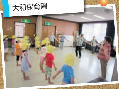
「よなGOGO体操」で つながる地域交流の輪