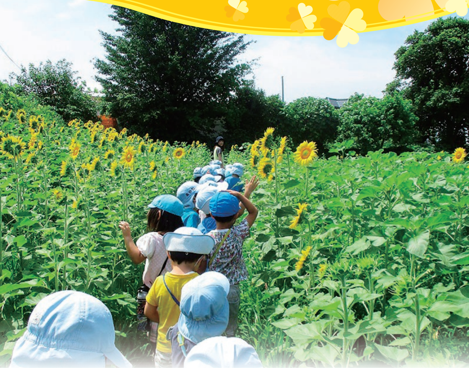
地域の方と一緒に植えたひまわり畑の散歩道（大和保育園）

社会医療法人仁厚会 発行：理事長 藤井啓子 〒682-0023 鳥取県倉吉市山根43番地 TEL(0858)26-1012 https://www.med-wel.jp/