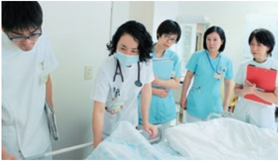
チームラウンドの様子

そのために本来受ける予定であった治療やケアが難しくなり、入院生活に支障を生じることもあります。認知症があっても、安心して治療を受けていただけるよう、職員の認知症に対する理解を深め、知識や対応力の向上を図るべく、各部署や各職種からの相談を受け、毎週1