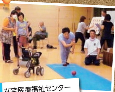
在宅医療福祉センター