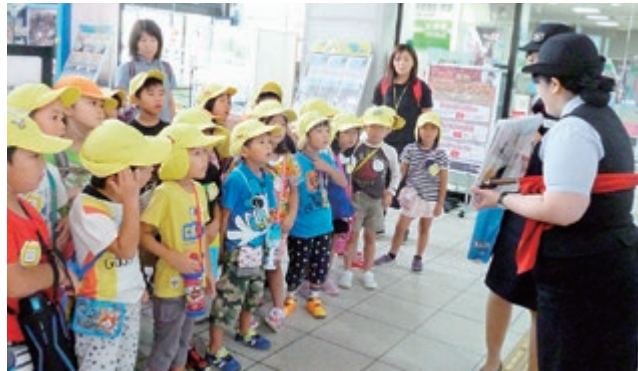
駅員さんがわかりやすく説明してくれました

着いた！」と、驚いていました。 公共の場でのマナーを楽しく学ぶ 貴重な体験ができました。