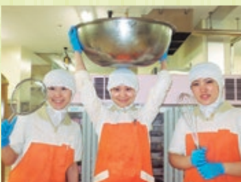
私たちが作ってます

「利用者様とどんな話をしたんです か？」 「かき玉汁の卵がふわふわで、どう やって作るの？作り方を教えて 〜」と言ってももらえました。今度フ ロアで作る約束もしたんです。 ユニット棟では、副菜の盛り付けも 利用者様がしているの、盛り付け も上手に盛り付けられます。 「これからのどんな食事を作ってい たいですか？」 今後利用者様の目の前で調理をし て、雰囲気も含めよりおいしく召し 上がっていただく工夫をしていき たいと思っています。 これからも利用者様に満足して頂 ける食事を 提供でき るよう、 職員一丸 となり頑 張ってい きます。」