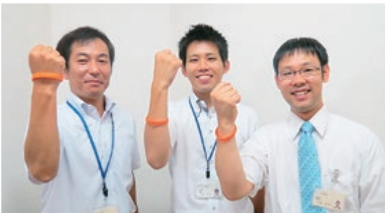
オレンジリングは認知症サポーターの目印です

仁厚会の各高齢者施設にも講座を開催できる講師(キャラバンメイト)が20名おり、出張研修も受け付けています。