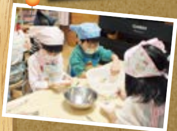
さつまいもぎょうざ作ったよ