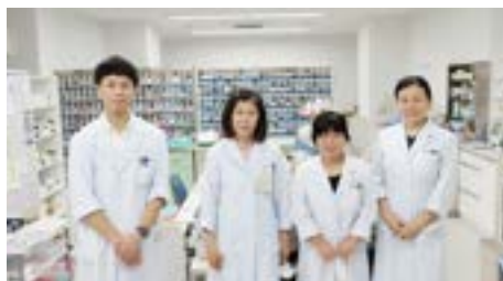
薬局スタッフ (引っ越し後の薬局内にて)