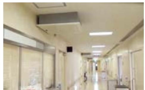
コロナ対応病棟 (手前天井陰圧装置・右側病棟/台は食事置き)