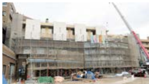
(西側) 外壁が出来上がってきました

既存の倉吉病院棟は、1階薬局の改修工事を終え10月14日に引っ越しを行いました。