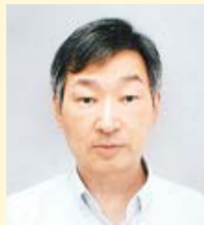
藤井政雄記念病院 内科