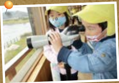
真剣!どんな鳥が見えるかな?