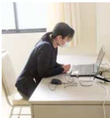
リモートによる受診の訓練