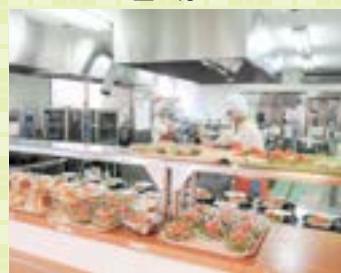
カウンターキッチン