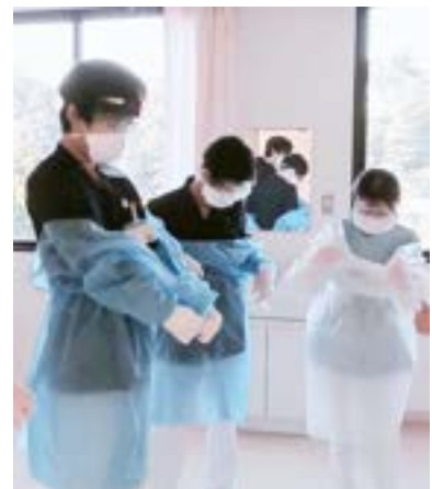
ガウンの着脱訓練

今後は地域内の状況に注意しながら、新型コロナウイルス感染症患者を安全に受け入れるため、スタッフの対応訓練を継続しながら、実践に備えていきたいと思っております。