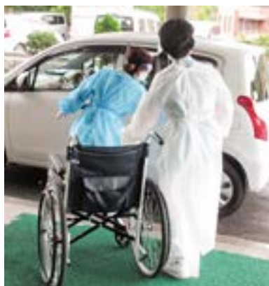
患者受け入れから退院までの訓練