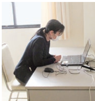
リモートによる受診の訓練