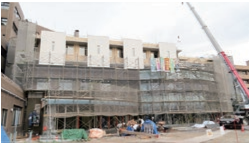
(西側) 外壁が出来上がってきました

既存の倉吉病院棟は、1階薬局の改修工事を終え10月14日に引っ越しを行いました。