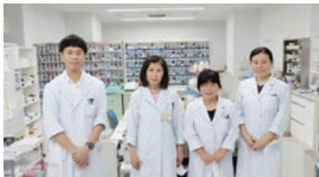
薬局スタッフ (引っ越し後の薬局内にて)