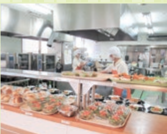
カウンターキッチン