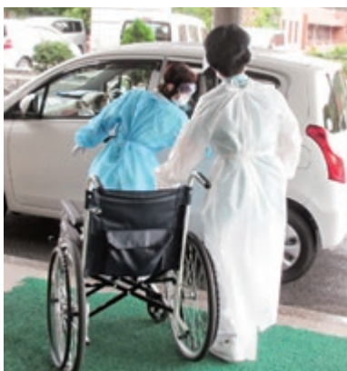
患者受け入れから退院までの訓練