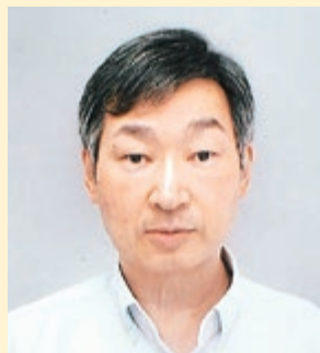
藤井政雄記念病院 内科