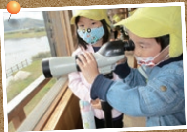
真剣!どんな鳥が見えるかな?