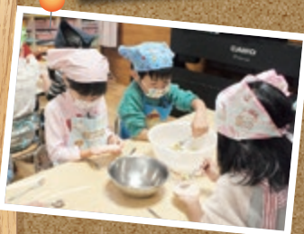
さつまいもぎょうざ作ったよ