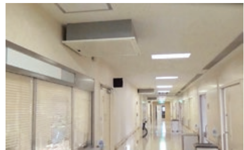
コロナ対応病棟 (手前天井陰圧装置・右側病棟/台は食事置き)