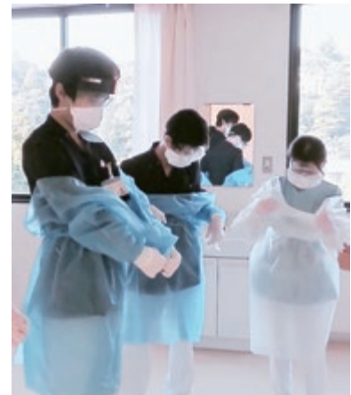
ガウンの着脱訓練

今後は地域内の状況に注意しながら、新型コロナウイルス感染症患者を安全に受け入れるため、スタッフの対応訓練を継続しながら、実践に備えていきたいと思っております。