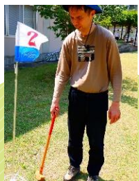
中庭でのグランドゴルフのご様子