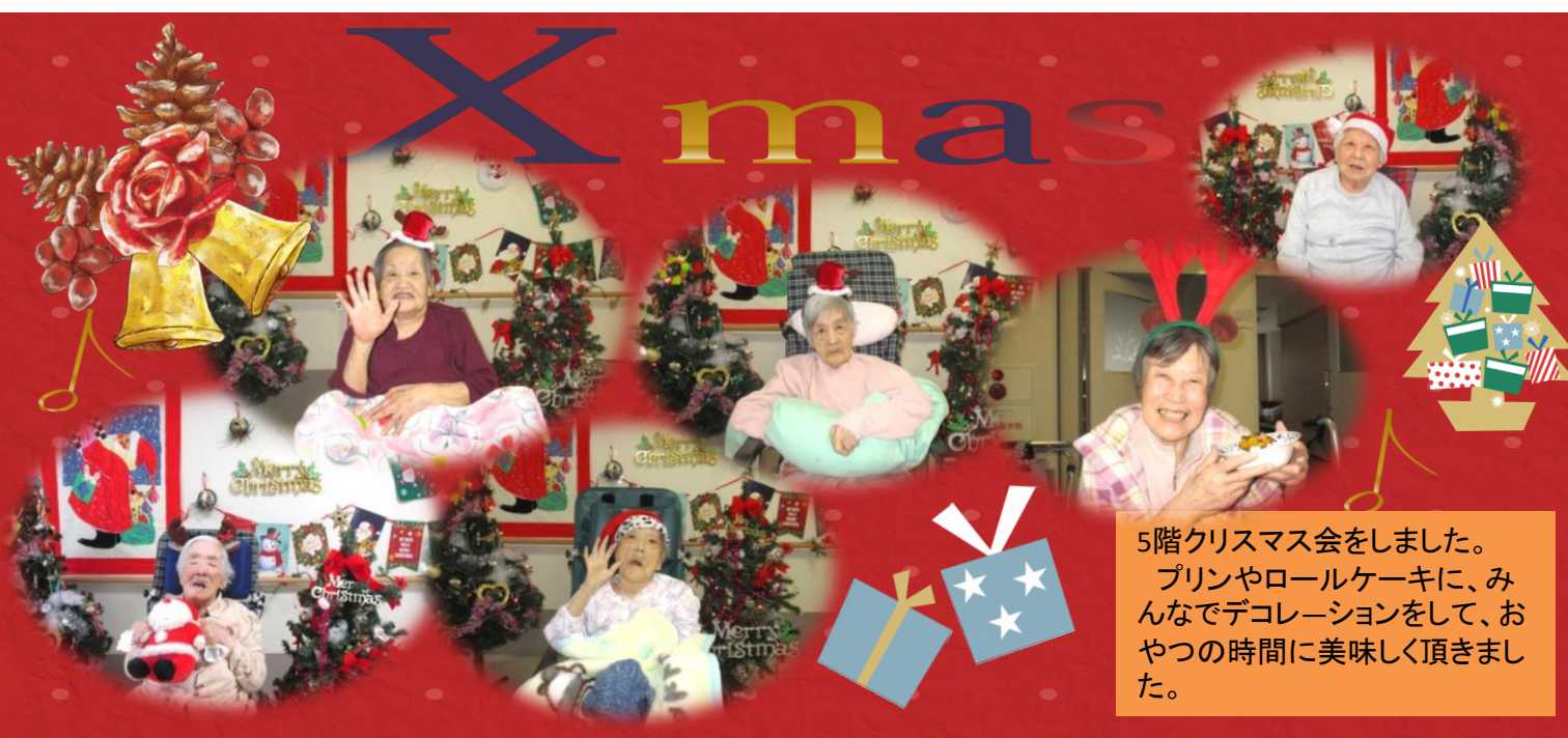
5階クリスマス会をしました。 プリンやロールケーキに、みんなでデコレーションをして、おやつ時間に美味しく頂きました。