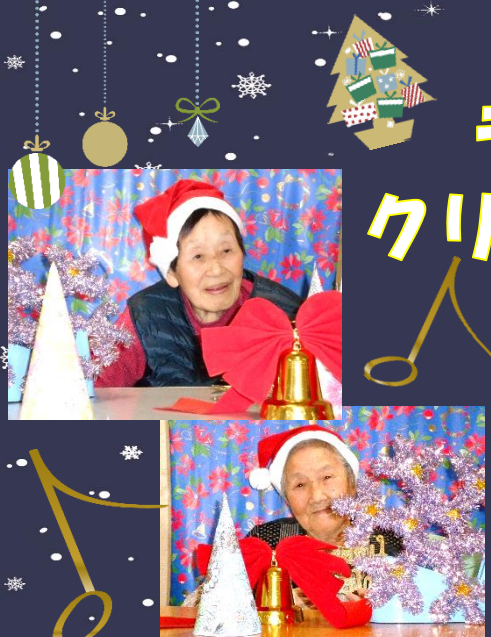
クリスマスはカレンダーやツリーを作りました。愛らしい顔やとぼけた顔まで、いろいろなサンタクロースでにぎわいました。