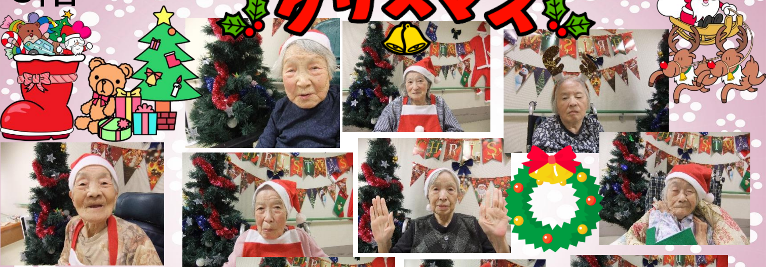
多目的ホールの壁にクリスマスの飾りを作り写真を撮りました。