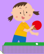
4階 ケアワーカー 野川 かおり