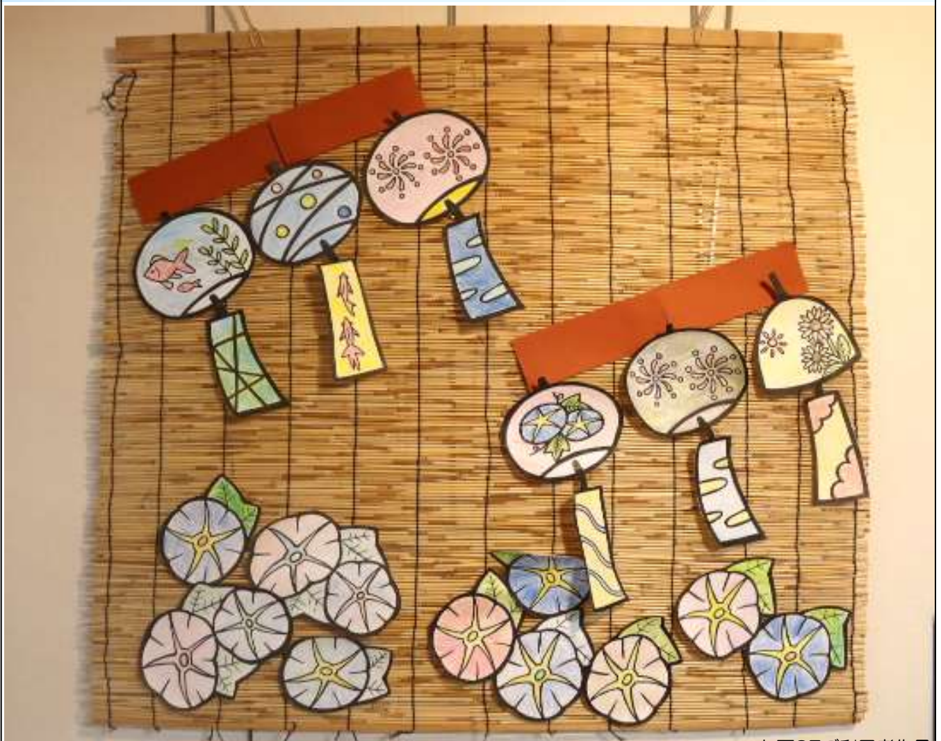
ユニット西2Fご利用者作品