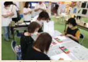
脳いきいきアート