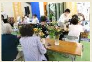
花による健康教室