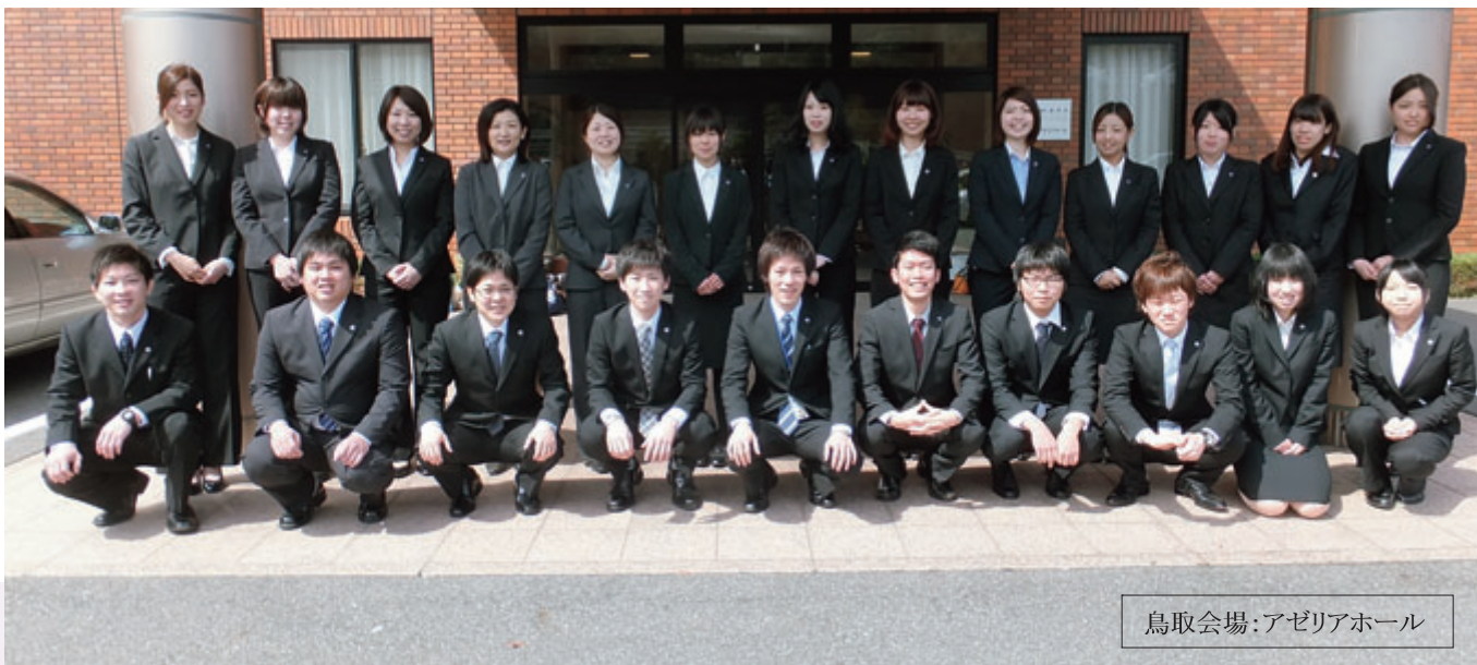
鳥取会場:アゼリアホール