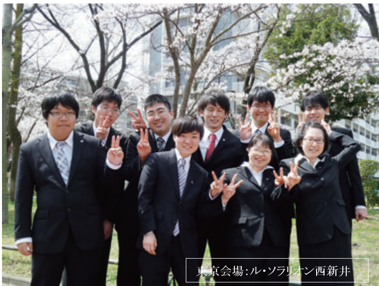
東京会場:ル・ソラリオン西新井

福祉の重要性が年々増してきている社会情勢の中、歴史と伝統のある敬仁会の一員としての今後の活躍に期待しましょう。