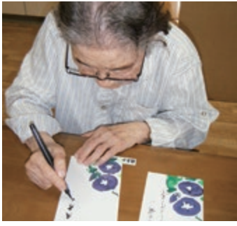
「元気しております。」

同時に現状もこまめにお伝えし、地域包括ケアで最も重要とされる「ご本人の選択とご本人・ご家族の心構え」を意識した意向確認を行い、支援を行うよう努めます。