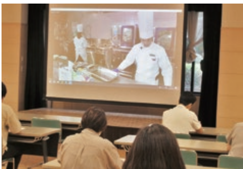
Webセミナーで見聞を広げます

喜ばれ、満足いただける食事提供のため、安全で美味しい食事提供はもちろん、業務効率及び待遇見直しにより業務負担を軽減した、高齢者・障がい者でも働きやすく、且つ、働きがいのある職場環境の確立を目指します。又、ロスを管理し、SDGs達成に貢献します。