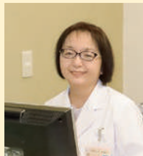
医療福祉センター 倉吉病院