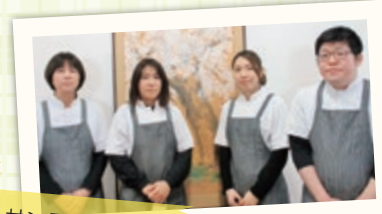
仁) サンテリアン北条