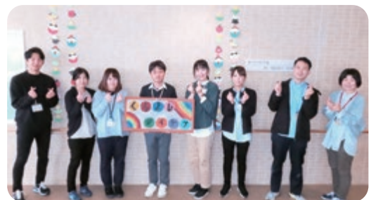
多職種チームのデイケアスタッフ

デイケアは、対人交流や集団活動などを通じて、より豊かな社会生活を目指していく為、個人の病状や目的に応じたりハビリプログラムを多職種チームスタッフで実践しています。