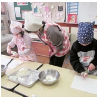
五感を使ったお味噌汁作り

平成30年4月より指定管理者となり、今年度で指定管理期間の満了を迎えることとなります。新たに園内に農園を作り、幼児の心と体を育てるクッキング活動を通じて、子どもの生きる力を育んでいけるよう取り組んでいきます。