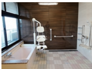
きれいになった浴室

6月まで改修工事は続きご迷惑をおかけしますが、新しくなる設備をみんな楽しみにしています。