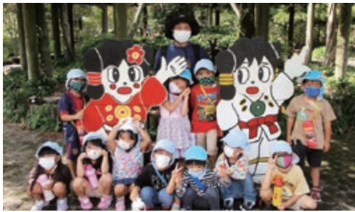
伯耆古代の丘公園にでかけました。園にはない落ち葉や木の実に大興奮！

の小学校との連携の強化を図り学ぶ力を持つ健やかな子どもを育みます。 子育てについては、保護者へ寄り添う支援を行います。また、公民館行事等への参加を通じて地域や保護者に信頼される保育園を目指してまいります。