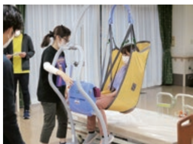
導入前の事前説明

本格導入してから間もないため、戸惑う職員もいますが、「最初は手間取ったが、慣れたら楽になった」、「腰痛予防になる」との声も聞かれています。安心して使用できる次世代介護機器を今後も検討していきたいと思えます。