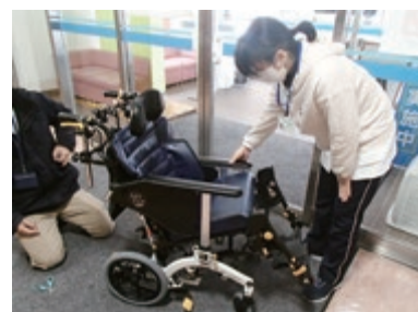
操作仕様を確認する作業療法士

福祉用具の更新を毎年度計画しており、ベッド、除圧マット等整備しています。最近導入した車椅子はオーダーメイドのように体にフィットし、小柄で円背のある方へ使用していただく予定です。ご利用者の快適で安全な生活のために必要な物品として、また働く職員にとってもご利用者の安楽なシーティングが容易になり安心してケアが行えます。