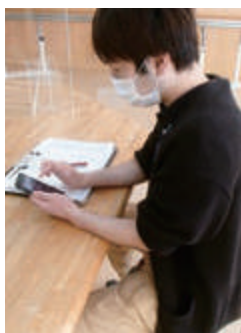
端末で気づきを入力

多角的にICTを活用し、専門性の高いサービス提供を目指すと共に職場環境の整備にも取り組みます。