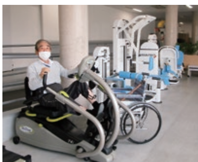
お一人おひとりにあたりハビリティを提供します

西部圏域の医療福祉施設等との連携を強化し、地域包括ケアシステムの一翼としての期待に応えるべくリハビリテーションに重点を置いた病院運営に努めます。そして、各部署がそれぞれの専門的な機能を活かしながら「地域に信頼される病院」づくりを進め、患者さんの地域での暮らしを支援します。