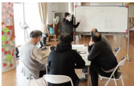
デイケアの若返る会で脳トレプログラムを実施

患者さんが「ここに来て良かった」と思え、職員が「ここから自慢できる」中部圏域の精神科中核病院として「訪れやすい精神科」を目指し地域社会に貢献し続けます。