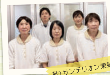
敬) サンテリアン東郷