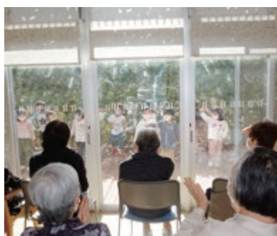
窓越しでの特養・保育交流

コロナ禍にあっても、感染対策を徹底しながら楽しみの多い生活を送っていただけるよう工夫していきます。地域との新たな交流方法を模索し地域連携・地域貢献に努めて