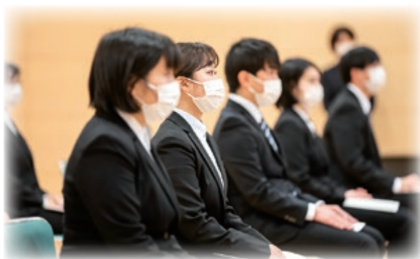
真剣な眼差しの新入職員