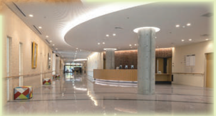
開放的なエントランスロビー・外来受付