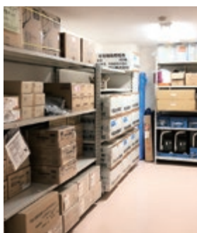
ラック（棚）を設置して整理整頓

大規模災害が発生しても事業が継続できるよう、防災備品の保管、管理方法を見直しました。保管場所を1階から2階に移し、水害対策を考慮しながら、いつでもベストな状態で備品提供ができるよう整理整頓を心掛けています。