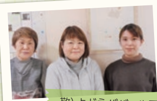
敬) よどえババール園

仁厚会・敬仁会では、全 17 厨房に約 140 名のスタッフが 1 日 3 食、365 日毎日途切れることなく給食調理を行っています。 普段は、厨房内での業務の為、皆さんの前に出る機会はありませんが、次号からの「JIN'S キッチン」では、スタッフのこと、病院・施設給食のあれこれを通して、給食の魅力をお伝えします。乞うご期待!! ※撮影の為、一時的にマスクを外しています。