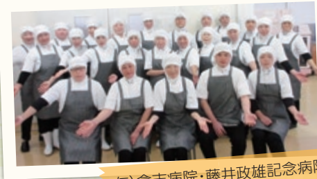
仁) 倉吉病院・藤井政雄記念病院