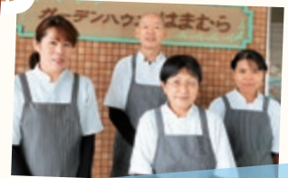
仁) ガーデンハウスはまむら