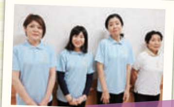
敬) ソラリオン名和