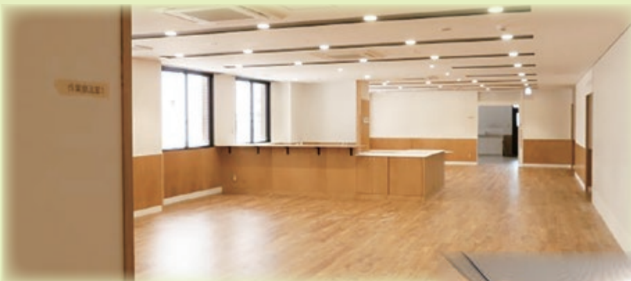
明るく広々とした作業療法空間