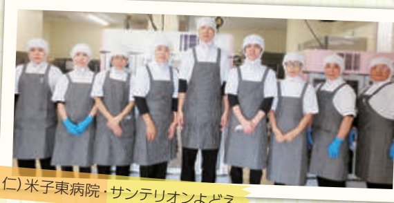
仁) 米子東病院・サンテリアンよどえ