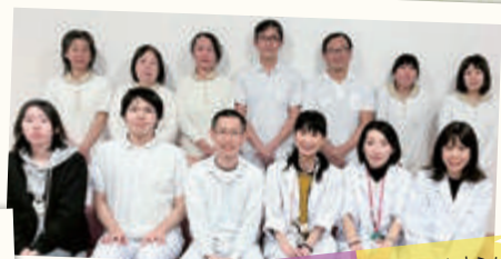
敬) ソラリオン・サンテリアン