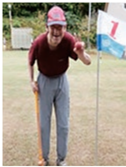
グラウンドゴルフに挑戦！

また、各事業の日課の中にコロナ禍での「生きがい・楽しみ」を創意工夫しながら追求し活動を提供するように努めます。