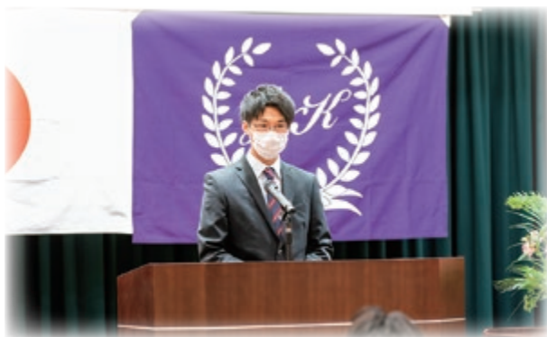
先輩職員激励の言葉