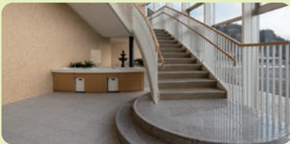
階段ホールより倉吉市内が一望できます