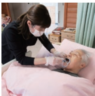
施設ご利用者の口腔ケア風景

口腔外科の多種多様なお口の問題に対応しています。新年度より、更に利便性を向上させるため、オンライン予約をスタートすることになっています。