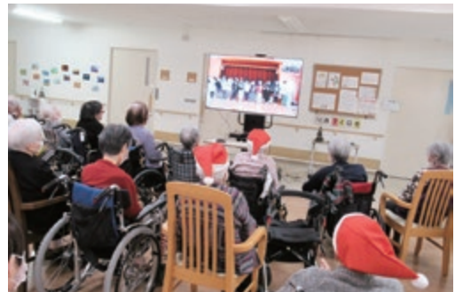
大和保育園とのオンライン交流