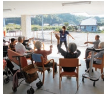
外でリハビリ体操

解し連携を図ると共に、安心して在宅復帰ができる仕組みを作り在宅生活を支援します。