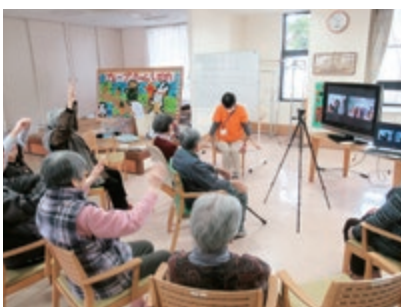
家族交流会の様子～WEBを活用し繋がりを大切にしていきます