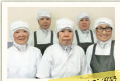
仁) サンテリアン鹿野