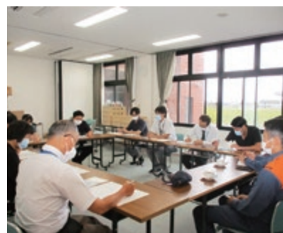
防災対応の強化に取り組んでいます

ら、業務の効率化を図り、必要とされるサービスを提供し続ける体制づくりに尽力してまいります。