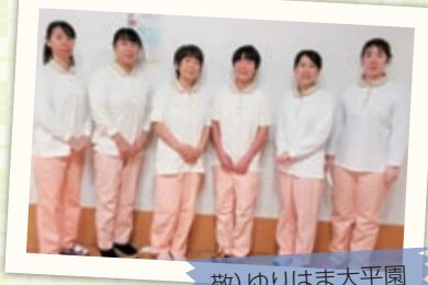
敬) ゆりはま大平園

「JIN'S キッチン」が生まれ変わります。 各厨房のクッキングスタッフが、 給食の魅力を紹介します。 ～次回、第一弾は、「ル・サンテリアン鹿野」です。～