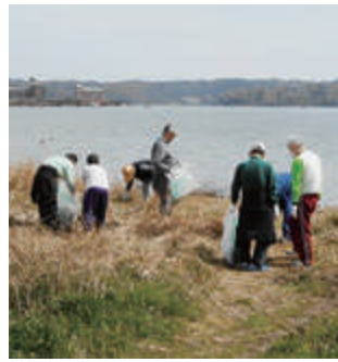
東郷池クリーン活動

また地域社会でさまざまな事情を抱える人の課題にどう応えていくのか、施設機能を活用しながらセーフティネット施設としての役割を果たしていきます。