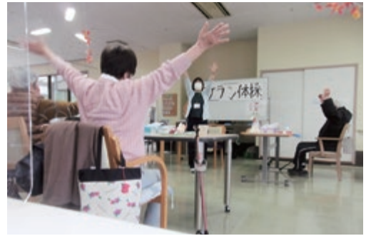
フレイル予防（コケラン体操）