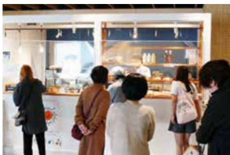
ファミリーデー開催 ご家族に実際の就労場面を見学していただきました

充実した療養環境の中で「質の高い精神科医療」を提供するため、特に依存症治療への取り組み推進や精神科災害拠点病院としての登録、在宅での療養支援やリハビリ機能の充実を図ります。中部圏域の精神科中核病院として「どのような症状の方でも相談しやすく訪れやすい精神科病院」を目指し地域社会に貢献し続けます。