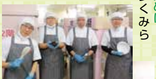
愉快的12人の仲間たち

「定着率向上のために」 離職理由で多くみられるのが「人間関係の悩み」です。上司と合わない、腹を割って話せる仲間がいらないなど、人間関係のストレスは仕事