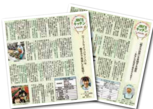
リニューアルした JIN'S キッチンで給食の魅力を PR

安全で美味しい、満足度の高い食事提供を理念に掲げ、省人化・省力化による業務の効率化を図るとともに、新人育成の要としてのリーダー・役職者養成に注力するなど人材育成に努めます。また、広報誌等を通じて給食の魅力を地域に発信していきます。