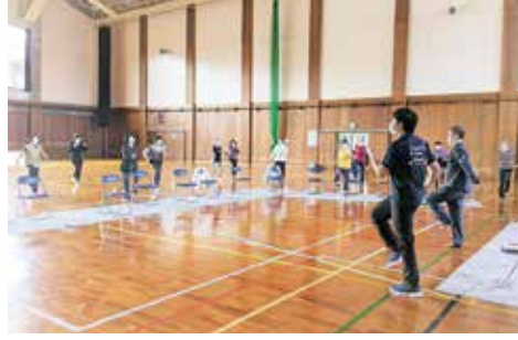
楽しく体を動かしてフレイル（加齢により心身が老い衰えた状態）予防！

事業特性を活かすことでサービスの拡充を図り、良質なケアが提供できるよう支援します。地域ニーズの把握に努め、施設機能及び専門性ある活動を展開していくことで、自立支援・重度化防止を促進し、地域に貢献していきます。