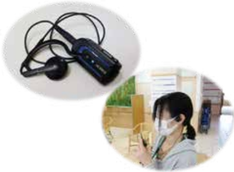
インカム 一両手フリーでフロアと通信。 —利用者対応もスムーズに！—

法人の総合相談窓口として安心してご利用していただける「地域ケアセンター マグノリア」へとリニューアル。その人らしく、自分らしく住み慣れた地域での生活が継続できるようデイサービスの時間延長、受け入れ基準の明確化を図りシームレスなサービス提供の実現を目指します。