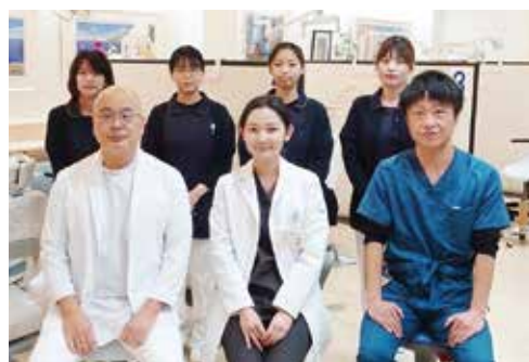
私達にお任せください

患者さん、並びに職員の為の Well-being（身体的・精神的・社会的に満たされた幸福な状態）の推進を行い、提供する医療の質を向上させ、満足度の高い時間を提供でき