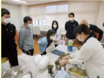
備蓄食品（雑炊）調理の様子

非常時でもご利用者に安心して食事が提供できるよう、必要備品の整備や備蓄食品の見直しに繋げていきたいです。