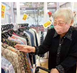
お買い物会で お好きな服を選んでください

感染対策を徹底しながら、地域との関わり、地域への貢献を広げていきます。テーマは「With Corona・After Coronaにおける地域連携・地域貢献」です。保育園との直接交流、お買い物会など外部の催しものの活用、ボランティアの再開などを行い、ご利用者に楽しみの多い生活が提供できるよう工夫をしていきます。