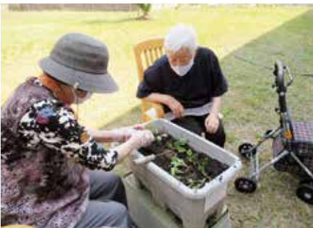
仲良く園芸を楽しんでいます

ご入居者の意思を尊重し、ライフスタイルに合わせた生活の維持を目指します。併設の関連施設だけでなく地域の関係事業所と連携し、住まい・医療・介護が一体となり切れ目なくサービスを提供します。また、ご入居者にとって居心地の良い生活環境を整え、清潔で温かみのある空間作りに努めます。