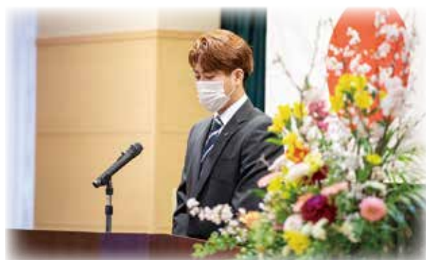
先輩職員激励の言葉