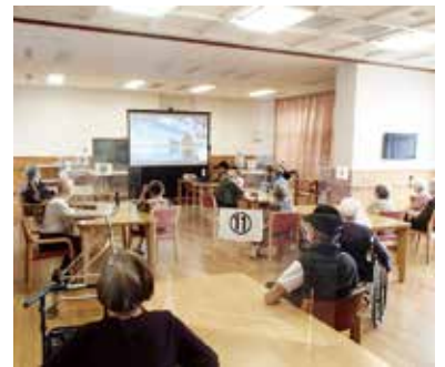
みんな元気に大腰筋体操講習会参加♪

多様な障害や生活課題を持つご利用者のニーズに沿った支援の提供と常時介護を要する方へ将来を踏まえたサービスの提供を行います。また、「認知症B