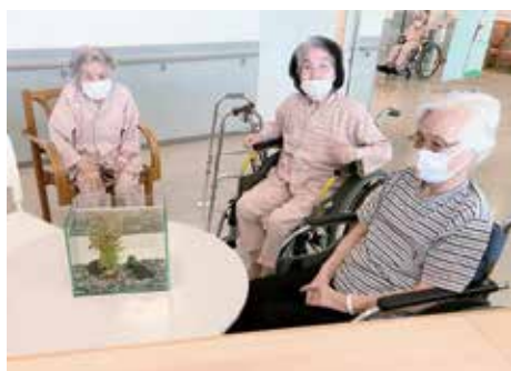
病棟でめだか観賞会を行いました

るよう努めます。また、地域の医療機関との連携を強化し、地域に「信頼される病院」として患者さんの暮らしを支援します。