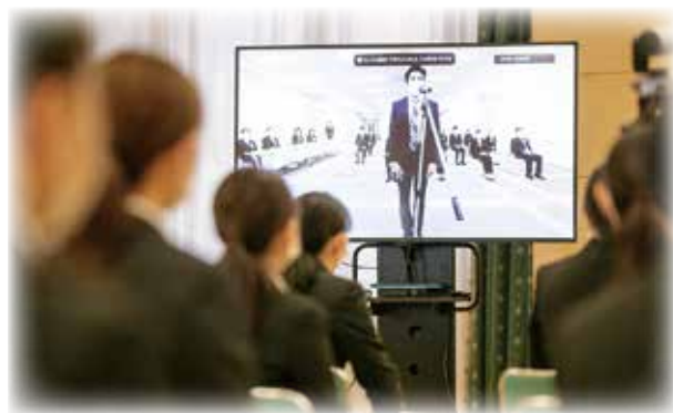
Zoom で東京施設と接続