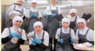
愉快的12人の仲間たち