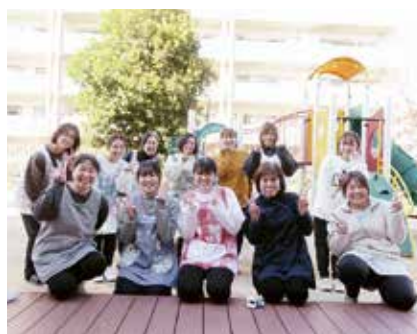
笑顔で温かい保育します！

「選ばれる保育園」となるため、利用者ニーズに 대응するべくECC英語レッスンやコーディネーション運動、学研もじかずランドを導入していますが、「二人ひとりを大切に」する温かい保育が基本です。仲の良さが自慢の職員全員が、笑い声の絶えない保育園で、子どもたちの「生きる力」を育んでいきます。