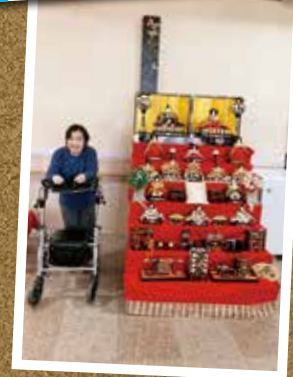
お雛様とパジャリ