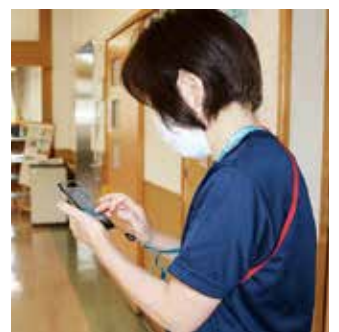
部屋に行かず状況を確認

昨年度から取り組みを開始した自立支援促進加算について、更にご利用者の自立へ向けた改善の可能性を探り、