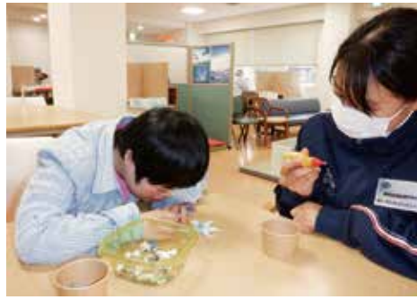
ご利用者の作品作りを支援する実習生

また、見学や実習を積極的に受け入れるなど地域と連携した取り組みを通じて、社会に貢献できる施設の実現に努めます。