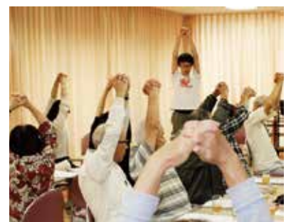
出前 健康教室 (コロナ前 第三団地自治会室で)

多職種連携による専門性の高い利用者サービスを提供し、その人らしい生活が継続できるように努めてまいります。