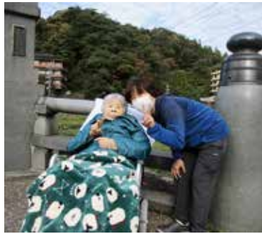
地元の温泉で記念撮影

ル・ソラリオン ご利用者一人ひとりの日々の喜びや楽しみへの支援として、今年度はふるさと外出や馴染みの場所への訪問など、地域で暮らされているお一人として、またご家族との時間を共有していただけるような取り組み、活動を計画し、最期まで笑顔が引き出せる生活を目指します。