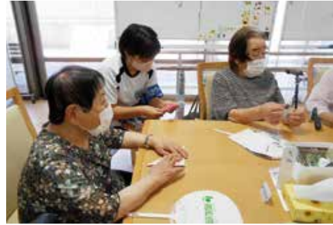
気高中学生の職場体験