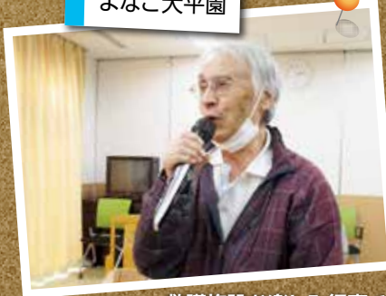
救護施設お楽しみ行事