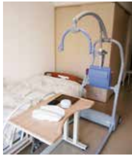
オムツセンサー& 介護マルチリフト

また、「排泄予測支援機器」ならびに「移乗支援リフト」など利用者サービスの向上や職員負担軽減を目的とした次世代介護ロボットの積極的な活用を進めてまいります。