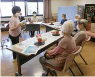
オレンジガーデニングプロジェクトに むけた臨床美術

ル・ソラリオン名和 時代とともに変化する利用者ニーズをキャッチし、団塊の世代の方々が実現したい暮らしと現状のサービスに乖離