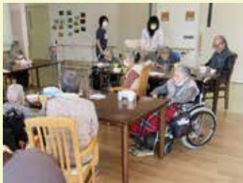
ご利用者にも食べていただきました