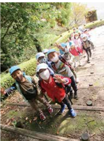
伯耆古代の丘公園の中をみんなで探検しました♪

地域社会の中で「豊かな心を育み、自立へと導く」ための保育を行うとともに、校区の小学校との連携の強化を図り学ぶ力を持つ健やかな子どもを育みます。子育てについては、保護者へ寄り添う支援を行います。また、公民館行事等への参加を通じて地域や保護者に信頼される保育園を目指してまいります。