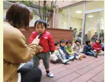
好きな食べ物は新幹線です ^^;

感染対策をしながら併設のル・ソラリオン綾瀬のご利用者との交流会を定期的に行っています。子どもたちは光庭で、歌を歌ったりダンスを観てもらったり、自己紹介をするときもあります。発表会の劇ごっこを披露すると、ご利用者のみなさんが手拍子をしながら応援してくれました。「可愛いねえ」「上手にできたよ」と感想を言ってくれて、また両手で大きな丸をしてくれて、子どもたちはクシャっとはにかんだ笑顔になりました。