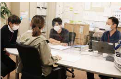
専門職が知恵を出し合う

湯梨浜町地域包括ケアの実現に向け、施設や各サービスの連携強化と「食」をポイントに専門職チームを中心にケアの質向上に取り組みします。また、コロナ禍で停滞した地域へのアプローチを企画する