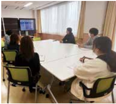
虐待防止研修の様子

心身に様々な障がいのある人や、多様な生活障害を抱える日常生活を営むことが困難となられたご利用者一人ひとりの希望に添ったサービス提供ができるよう、日頃より職員の間力向上と専門性を高めるための取組みを意識し、良質で安心・安全な支援の提供を継続してまいります。