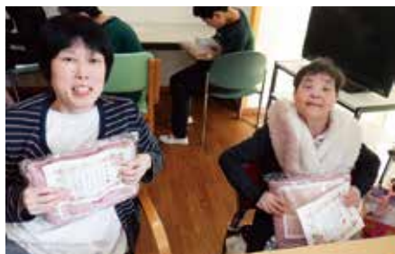
メッセージと記念品を受け取るご利用者

3月、毎年恒例の「やよい会」が開催されました。やよい会は、生活介護の1年間の活動を労う会で、ご利用者が楽しみにされている活動の一つです。当日は、職員から一人一人に「ワーク活動にがんばりました」「元気に通所できました」など書かれたメッセージカードが手渡され、ケーキとジュースで笑顔あふれるひとときを過ごされました。