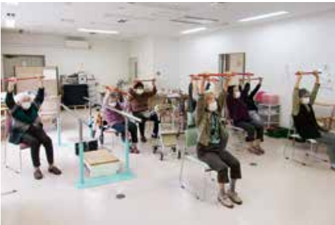
予防通所（2部制）ではリハビリに全集中

を追求します。（well-beingとは幸福に満たされた状態） 介護、看護、リハビリテーション等、それぞれの専門性を発揮するとともに、多職種連携によるチームワークで在宅生活の継続と在宅復帰を支援します。