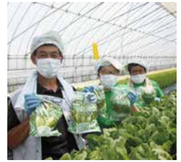
水耕野菜の収穫（ハッピーバーディー）

生活困難者のセーフティネット機能を有する施設であり、地域における社会資源として幅広く認識されるように取り組んでいきたいと思っております。そのため障害を問わず多種多様な社会的ニーズに対応していただけるように努めます。