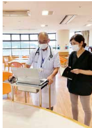
回診中もすぐに電子カルテへ入力可能に