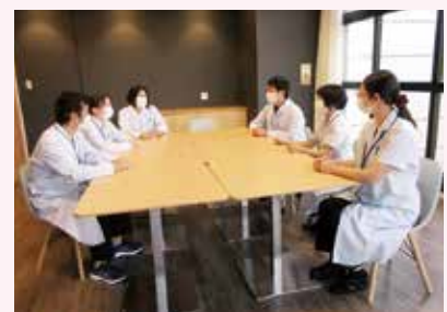
心理チームで意見交換

集団療法では、一人では思いつかないことを他の人から学んだり、同じような立場の仲間に出会って癒されることもあるでしょう。みんなでワイワイやっています。興味のある方、希望のある方は担当医師または心理部門へご相談ください。