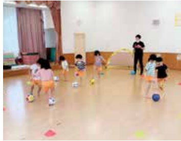
ボールを足で止める練習

その中の一つとして職員の趣味であるサッカーの楽しさを知ってもらおうと、今年度より毎月サッカー教室を行っています。十分に体を動かす気持ちよさを体験し、自ら体を動かす意欲が育つことをねらいとし、みんなで汗を流しています。チームプレイを通じて協調性やねばり強さを養うと共に、「ボールを蹴ること」「ゴールを決めること」「できなかったことができるようになること」等、様々な楽しさの中で子どもたちが成長して欲しいと願っています。