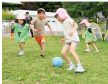
試合でボールを追いかける様子