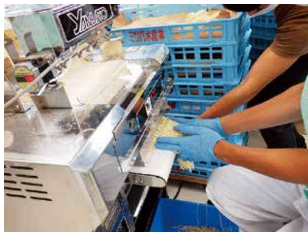
ご利用者と共に試行製造開始

最新鋭製麺機で製造した自慢のそば・牛骨ラーメン・うどんを皆様へ提供できる日を、ご利用者・職員一同、心待ちにしています。きっと満足していただけたと思いますので、ご期待ください!