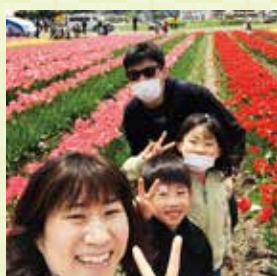
チューリップに囲まれて