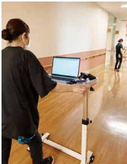
バイタル測定し、その場で入力

上記に加え、カルテを新しくしたことで、自分たちの記録について改めて考える機会にもなりました。日頃のケアについて正しく適切に記録ができていないか確認し、よりよい記録作りを意識づけていきたいです。