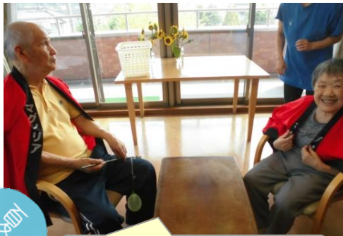
ハッピーを着たら気分は祭！