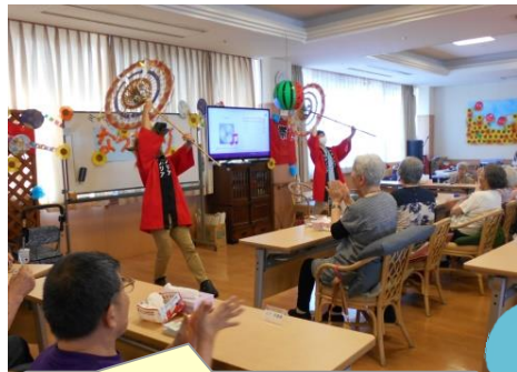
職員の傘踊りも決まっています♪

先月に続き各階で夏祭り行事を開催しました。今年は屋内での開催ですが、皆様に「夏」を感じて頂けたのではないのでしょうか！？