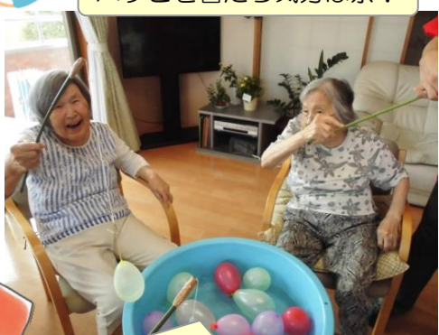
ヨーヨーがつかえました♪