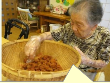
立派な梅干しができたなあ

さっそく皆さんで試食してみました。『すっぱいけどおいしい〜!!』と今年も好評でした。