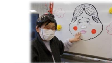
福笑いうまくできました♪