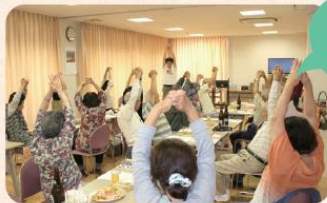
自治会での 集会参加（体操）

ル・ソラリオン西新井は、地域の方々に暖かく見守られ地域の方々と共に生活を送っています。 支え合い、喜び合い、考え合い、より良い安全で快適な環境を目指しています。