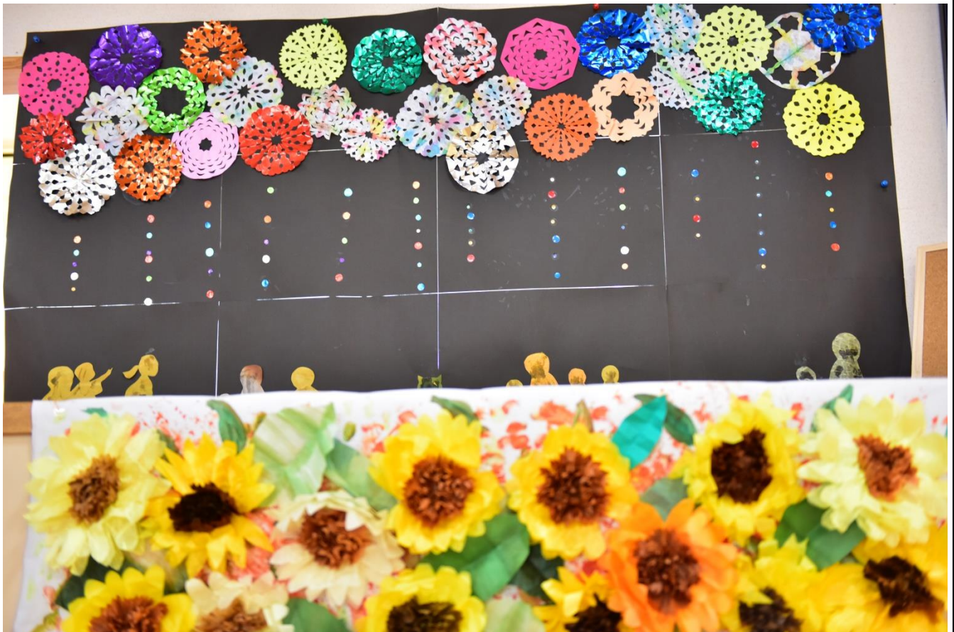
写真：花火とひまわり（ユニット西2ご利用者の作品）