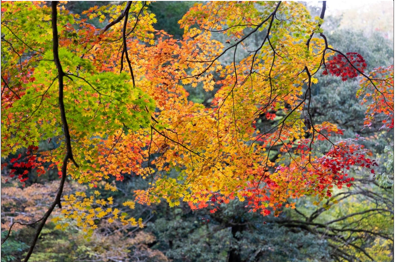
写真：大山の紅葉（撮影者：Y.K）