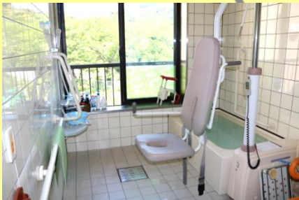
◇ユニット西棟はリフト浴完備