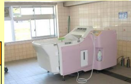
◇ユニット東は機械浴完備