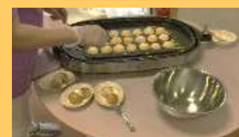
ホットケーキ作り