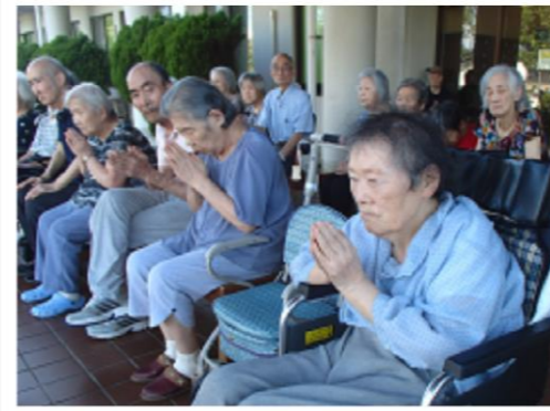
手を合わせて見送ります (送り火)

感謝の気持ちを「ようこそ、ようこそ」とお話しして下さる利用者の方の、お言葉を頂き、このタイトルを付けさせて頂きました。みなさん、「ようこそ、ようこそ」