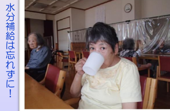
水分補給は忘れずに！