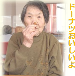
ドーナツおいしょ