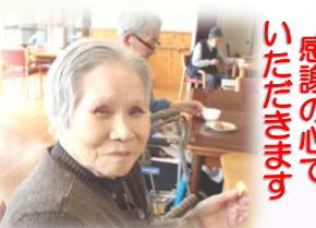
感謝の心で いただきます