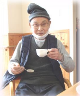
やっぱり コーヒーだな