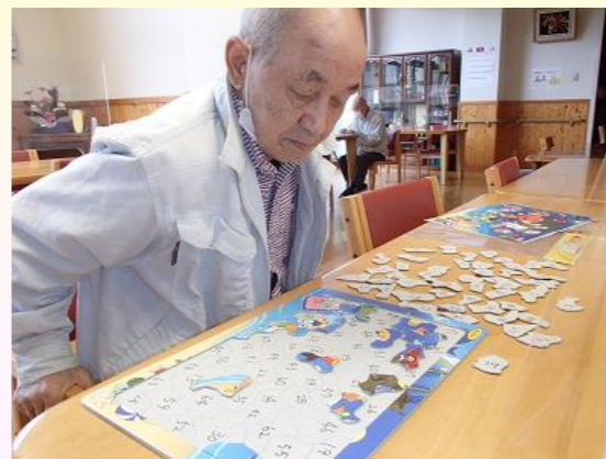
うーん、これは難しいなあ