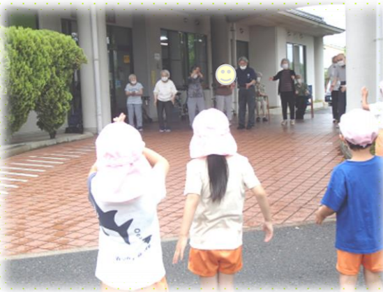
上井保育園との体操交流