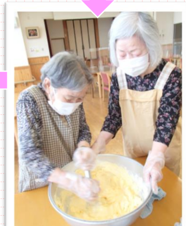
バナナも加えて混ぜます