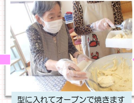
型に入れてオーブンで焼きます