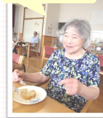
また作ってくださいね★