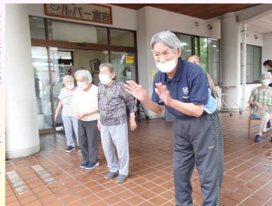
(体操交流) また来てね!