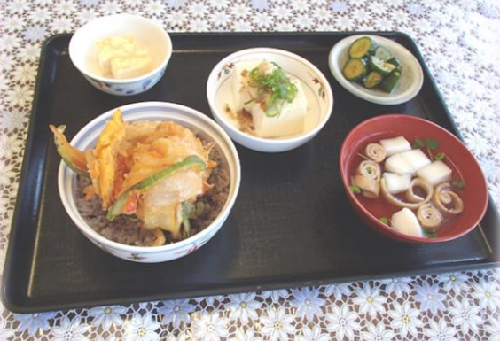
夏越ごはん、すまし汁、冷奴、ピリ辛きゅうり、デザート

ご利用者の皆さまに元気に過ごしていただける様、昼食は「夏越ごはん」にしました。暑い日にも箸が進むメニューでとても好評でした。