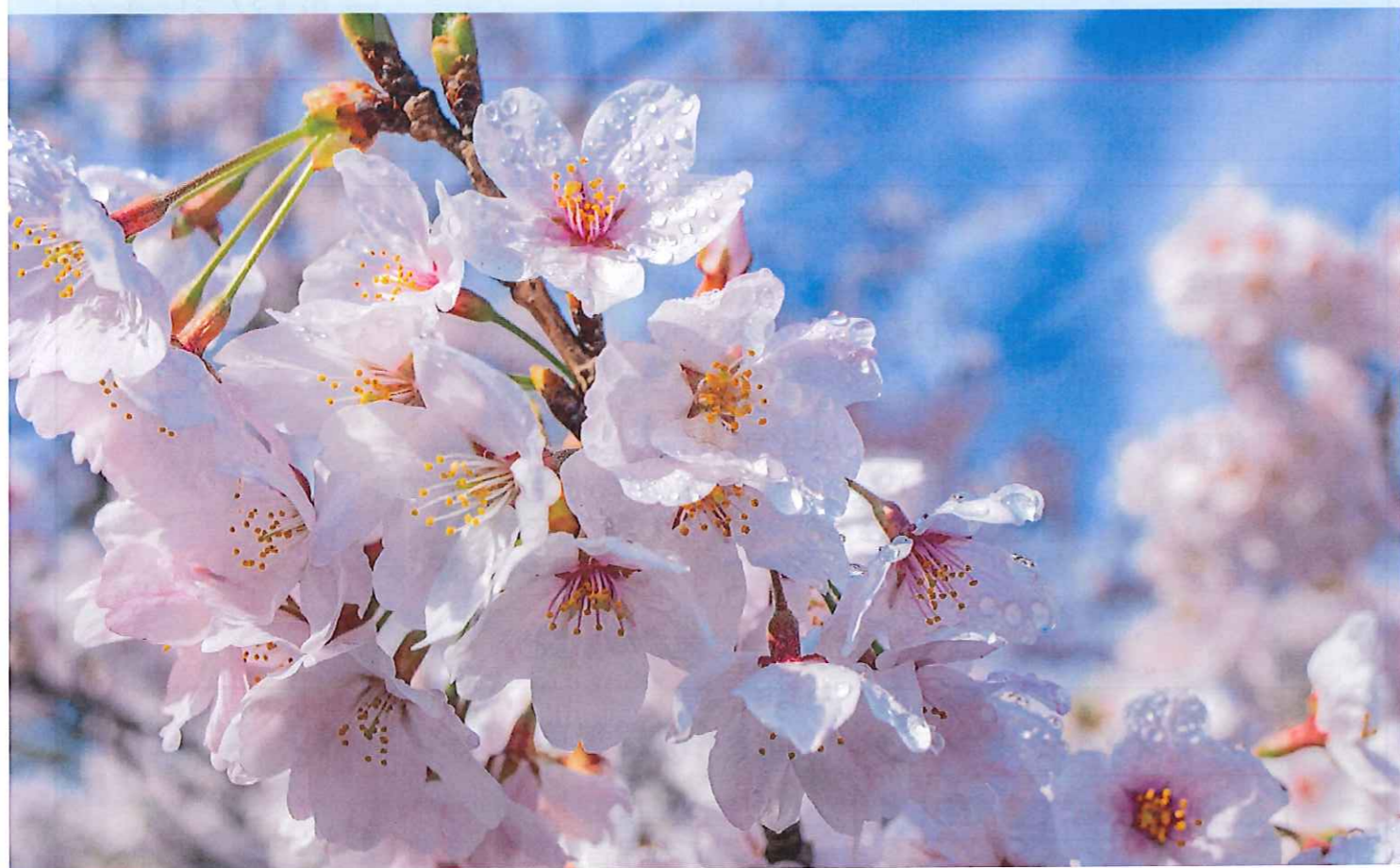
青空に映える 綺麗な桜色