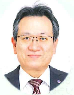
ル・ソラリオン 施設長

後期高齢者の増加、労働者人口の減少の2025年、2040年問題を見据えて今年、職員の働く環境の改善に取り組んでいきます。ICT（情報通信技術）の技術を介護現場へ導入して職員の負担軽減、仕事の効率化と介護人材不足解消の為に初めて外国人スタッフの採用に取り組んでいきます。ご利用者の一日一日を大切に安心した“暮らし”が送れるよう皆様のご理解、ご協力をお願い申し上げます。