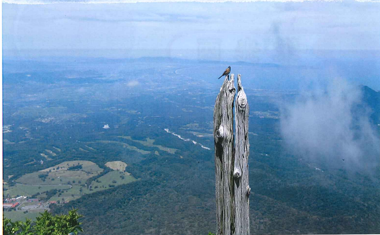
大山七合目付近 草鳴社ケルンから弓ヶ浜を展望する

・ココが知りたい！ソラリオン ・新入職員の紹介・2月のお祝いご膳 ・お知らせ～ご家族の皆様へ お願い～ ・2月～3月上旬の予定 ・編集後記