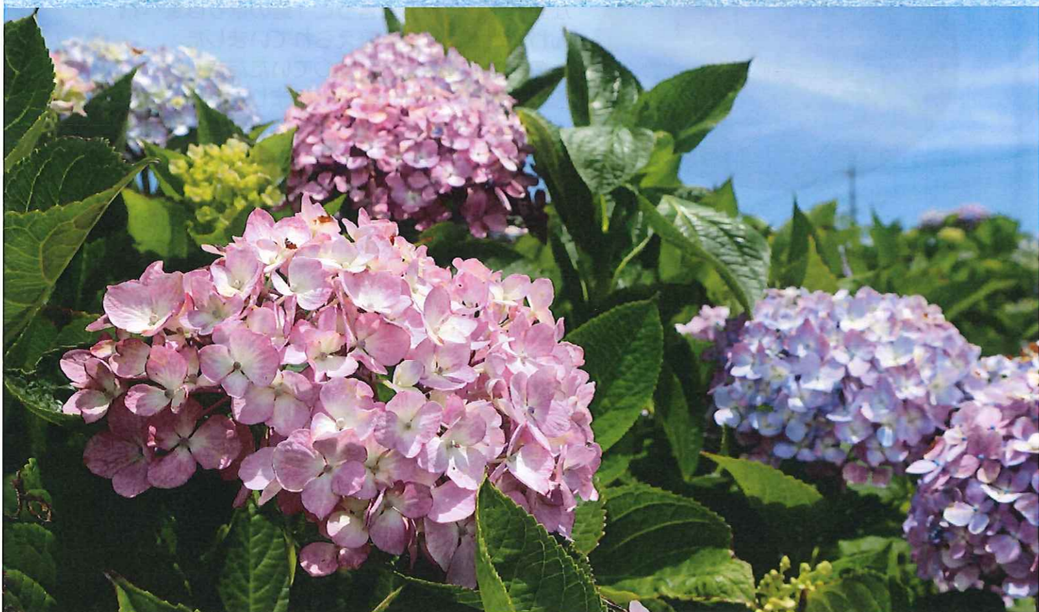
梅雨の合間 青空のもとに咲く あじさいの花