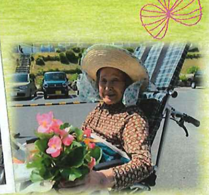
▲皆さん帽子がお似合いです