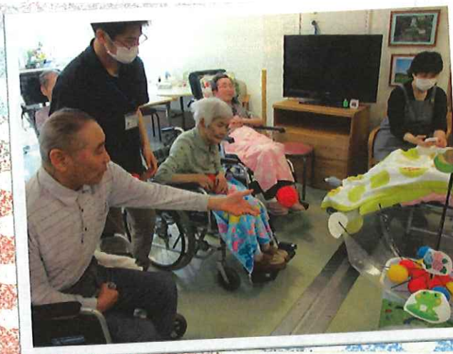
▲狙いを定めて～エイッ！