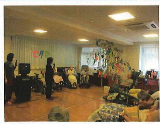
▲一番の願いは健康ですね

平安東での七夕行事では、短冊に書かれた願いごとを、お一人ずつ発表して頂きました。 皆さんの願いが叶うよう「七夕さま」の童謡を一緒に歌い、最後は冷たいデザートでお腹も満足。 楽しい七夕行事になりました。