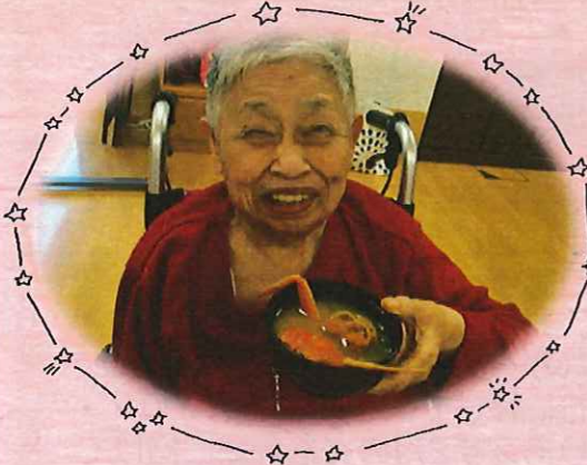
▲思わず笑顔があふれます