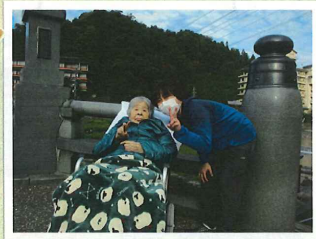
▲三朝大橋の前でじっくり

地域で過ごされた思い出話や、施設では見せられない表情を浮かべられ、ご利用者はもちろんのこと、付き添った職員も温かな気持ちとなるひと時でした。