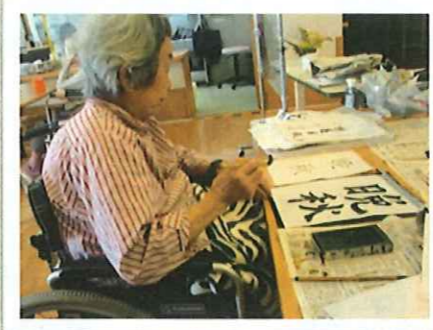
皆さんが真剣な表情で制作に集中

平安西1丁目ではこの時季の家庭料理として親ガニの味噌汁を作りました。 皆さんが「いい匂い！」「うまいな～」と喜ばれ、お代わりされていました。 匂いの物は何よりのごちそうですね。