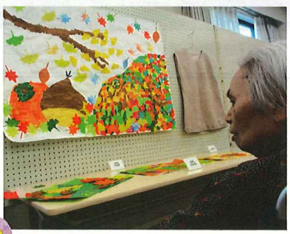
「上手にされてますな～」