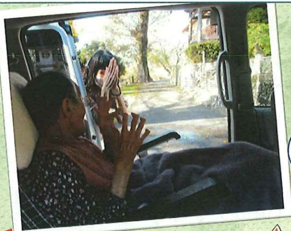
▲お参りに通ったお寺の境内で