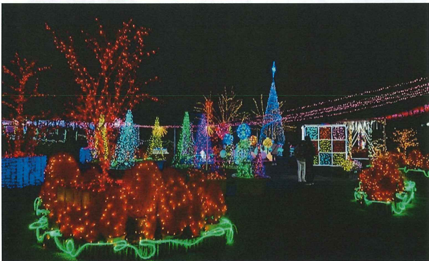
とっとり花回廊の華やかなイルミネーション

・冬の花壇作り ・11月のお祝いご膳 ・編集後記 ・クリーンパーテーション設置 ・12月～1月上旬の予定