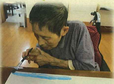
▲左手を添えて慎重に

ご利用者の余暇時間の充実と、作品作りを通してのリハビリ目的として今年度も文化祭を開催しました。 フロアごとに秋をモチーフにした貼り絵や、手芸品、習字、塗り絵など沢山の作品が展示されました。