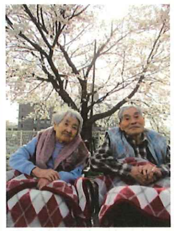
▲ご夫婦揃って仲良く花見