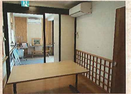
▲プライバシーに配慮した空間と、エアコン設置で快適に面会していただけます。