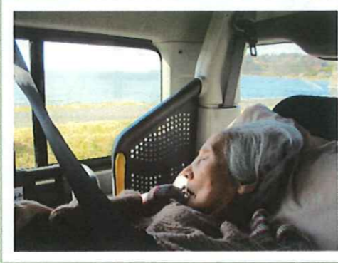
▲地元の海辺に思いを馳せて