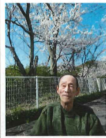
▲きれいに咲いとるな～