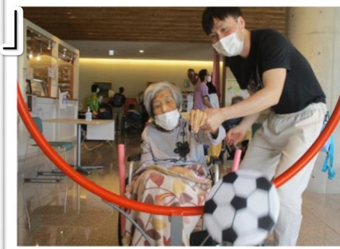
▲初めてドッチビーを体験！