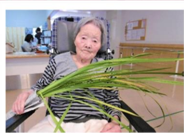
▲無病息災を祈って

端午の節句行事として菖蒲湯を行いました。 「菖蒲か！うち家は屋根に向かって投げとたて」と思い出を語られる方も。 皆さんで香りを感じた後は、湯船に入れ、リラックス効果を堪能されたようです。