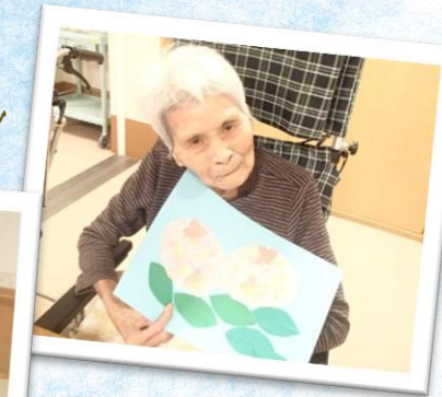
▲大作の壁飾りが完成しました