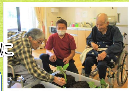
▲もうちょっとこっちな

プランターにひまわりの種まきと、サツマイモの苗植えを行いました。昔のことを思い出しながら職員に植え方を教えられる方も。 皆さんでこれからの成長を楽しみに、ベランダの様子を見守っていきましょうと思います。