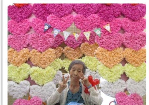
▲フォトスポットで映え写真♡