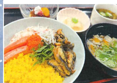
▲ちらし丼は7種類の具が乗った豪華版！！