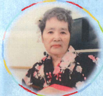
▲お化粧もされました