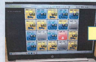
▲パソコン画面で全利用者を把握