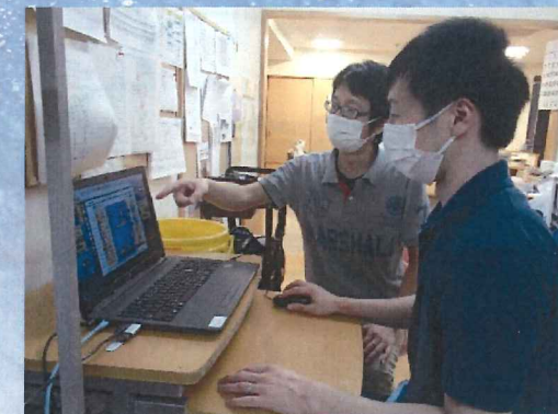
▲ご利用者の睡眠状態を確認

「ご利用者個々の呼吸数、心拍数が基準値から外れた場合にアラート設定をすることで異常の早期発見に繋がり、看取りケアでの活用もイメージできました。ご利用者の眠りを妨げないように、排泄ケアはすぐに取り組みめるのではと思います。また眠りスキャンを活用したデータから個別ケアに取り組まれていることを知り、日中の活動時間や臥床時間、夕食後の余暇時間の取り方などフロアで検討したいと感じました。」