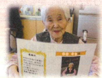
▲昨年のメッセージカード

ご家族の皆様からの、温かいお祝いの言葉をお待ちしておりますので、よろしくお願い致します。