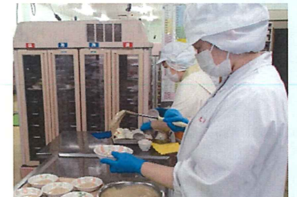
△盛り付けはスピーディーに、でも丁寧に想いを込めて…

実習を終えて、「学校では学べないことが学べた」「今後活かして素敵な栄養士を目指したい」などと話されていました。