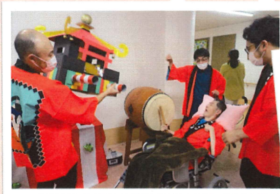
▲みつばし音頭に合わせてドンドン♪