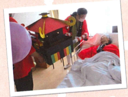
▲居室にも神輿が回りました。