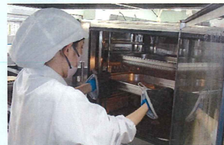
△火傷しないよう気を付けて…。仕上がりはどうか？

お2人とも意欲的にかつ楽しみながら取り組まれ、実際の介護現場における食事提供について