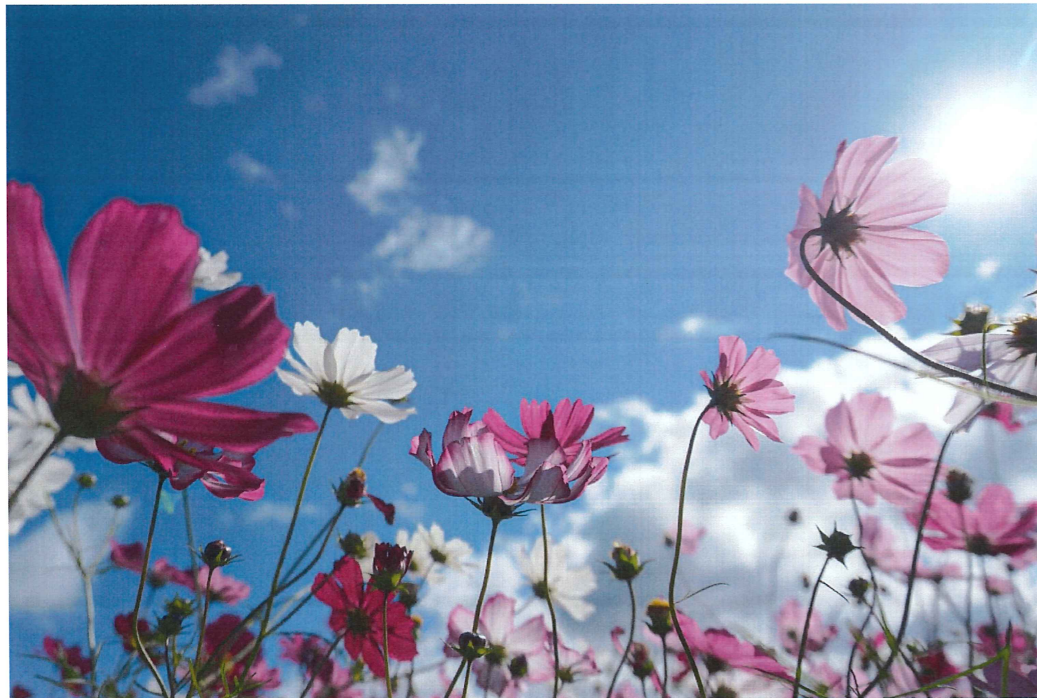
「コスモスに 風ある日かな 咲き殖ゆる(ふゆる)」杉田久女

◆ 4面 ・実習生受け入れ ・9月～10月上旬の予定 ・8月のお祝いご膳 ・編集後記