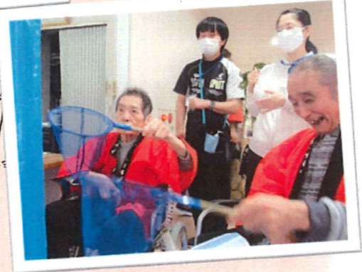
▲ヒラヒラ舞い上がる蝶を捕まえるゲームに挑戦！皆さんお上手でした。