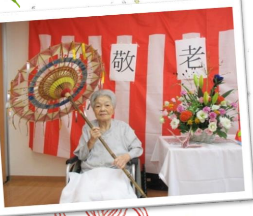
△練習の成果を披露！