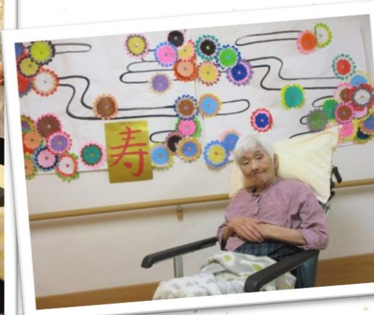
△ご利用者が制作された壁飾り