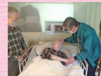
△初めての居室面会にて

予約：事前に電話でのご予約（8：30～17：30）。引き続き面会室のご利用、オンライン面会も可能です。ご家族が多い場合は面会室利用のご協力をお願い致します。