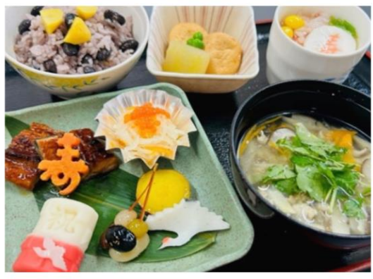
△華やかなお祝い敬老ご膳