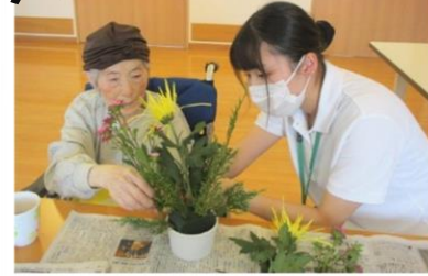
△ここに挿みましょうか