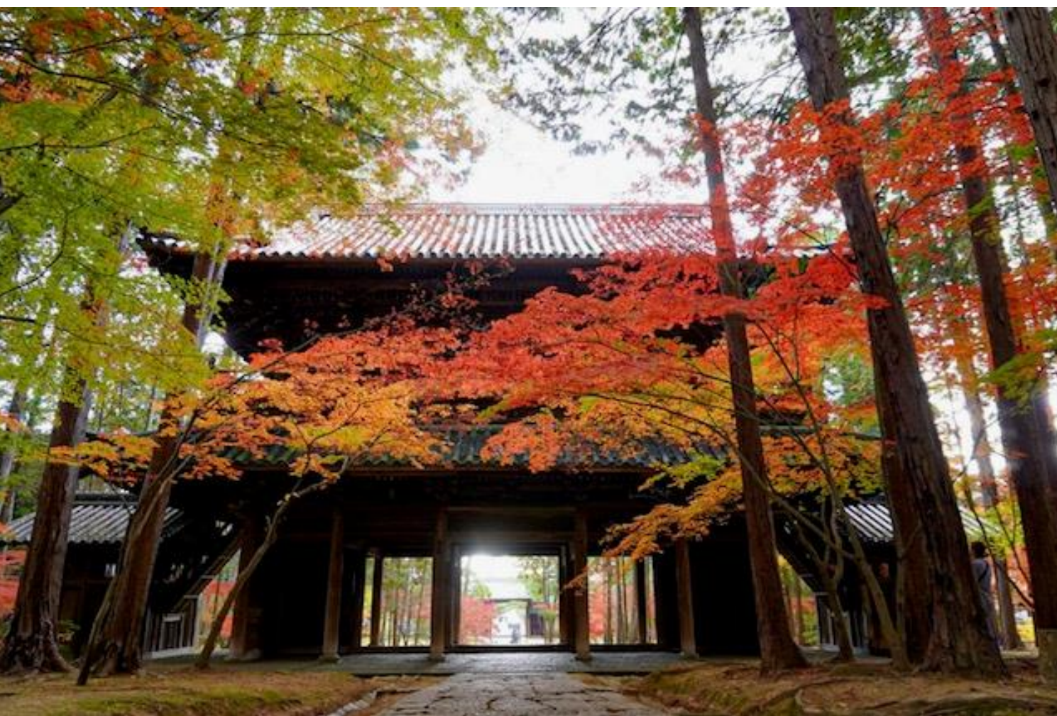
紅葉の名所として有名な岡山県中区円山にある曹源寺

皮をよく洗ったサツマイモをアルミホイルで包んで、両面の魚焼きグリルで弱火で30分焼いて、10分置いておくだけで甘くてホクホクの焼き芋が出来上がるのでぜひお試し下さい。(中村こ)