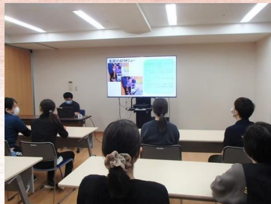
▲熱心に聞き入る職員