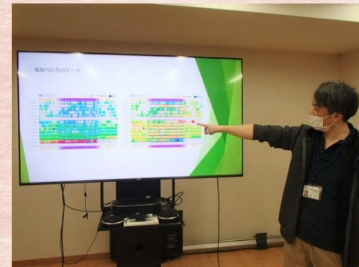
▲希望西：眠りSCANのデータを説明し今後の活用方法を伝達。

ソラリオン介護課の7フロアが、ご利用者へのサービス向上を目的に、年間を通してそれぞれ取り組んだ成果をまとめ、施設内研究発表会を開催しました。