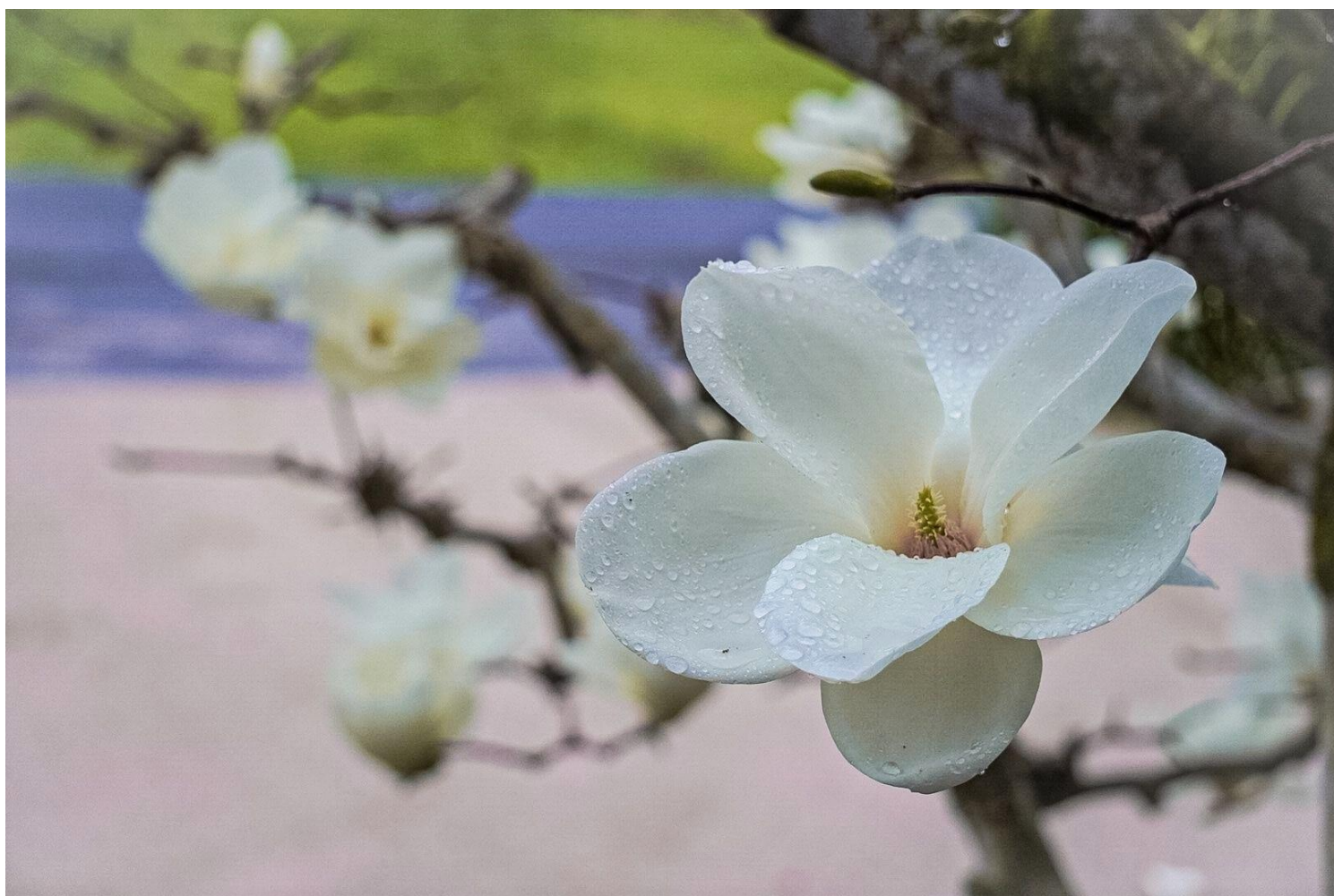
▲爽やかな香りで春の訪れを感じさせる白木蓮

◆ 4面 ・施設内研究発表会開催 ・2月のお祝いご膳、雛祭りご膳、手作り甘酒 ・3月～4月上旬の予定 ・ご意見受付箱より ・編集後記