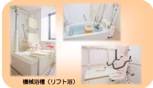
機械浴槽（リフト浴）