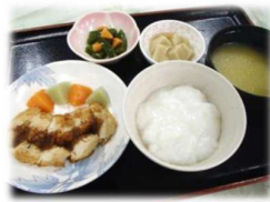
ソフト食（やわらか食）