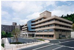
藤井政雄記念病院