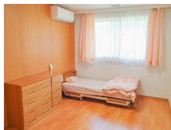
ユニット型個室/従来型個室

希望される生活が過ごせるよう、可能な限り家庭に近い生活を送って頂けるよう、個々のニーズに合わせた環境で利用できます。