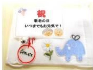
刺繍入りマスクプレゼントしました♪