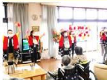
笑顔がたくさん溢れました♪