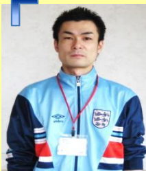
デイサービス: 新川課長補佐