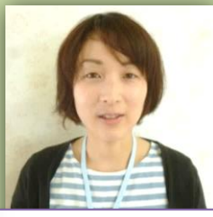
にほんかい: 中土井

ご利用者の出 来る事を増やし、 希望を実現し、 生活に意欲が もてるよう支援 していきます。