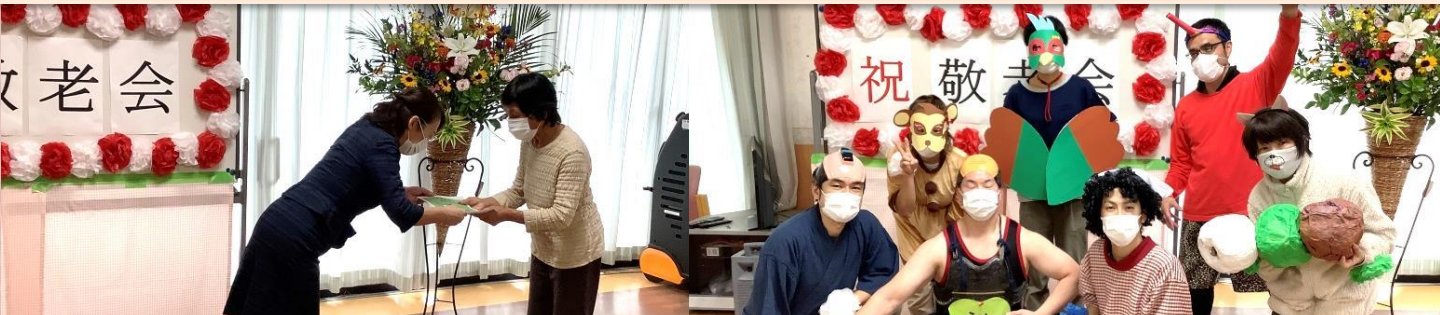
【デイサービス】 敬老会で、ご長寿をお祝いしました。