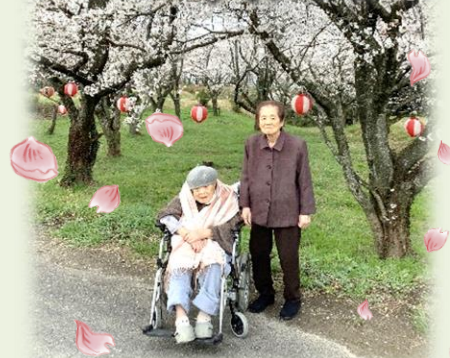
今年も桜の開花と共に、花見に出かけました。