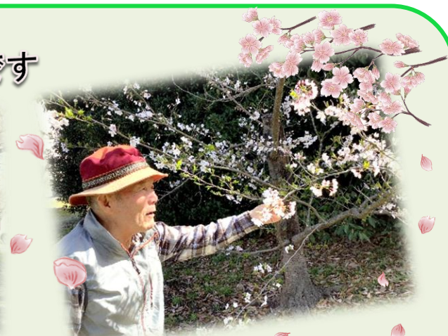
満開の桜の下でパチリ♪