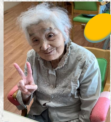
お団子は手作りしました♪